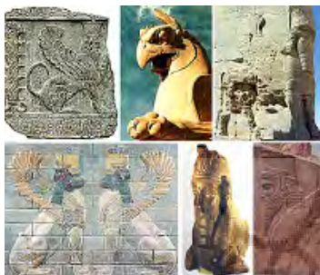
تصویر ۲۸ - هخامنشی.

می‌خورد (تصویر ۳۵). اسفینکس در اساطیر و هنر یونان هیولایی با سر زن، بدن شیر ماده، بال‌های عقاب و دمی با سر مار بود که نقشی بدخواهانه داشت و موجب خرابی و شوربختی می‌شد. به نظر می‌رسد واژه اسفینکس از فعل اسفینگو (به معنای فشردن) آمده باشد. شاید بدین سبب که شیر گلوی شکارش را می‌فشارد (Liddell, 1996, 312). هرودوت در توصیف تندیس‌های مصری، گوپت‌های با سر گاو را «کریو اسفینکس» و نمونه‌های با سر شاهین را «هیراکو اسفینکس» نامیده است (Gwynn-Jones, 1998, 213). در اساطیر یونان نیز یک اسفینکس دیده می‌شود. هزیود،