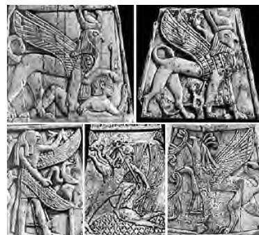
تصویر ۱۱- عاج کندهای آشوری.

انسان برای ماتیو (متی)، شیر برای مارک (مرقس)، گاو نر برای لوقا (لوقا) و عقاب برای جان (یوحنا).