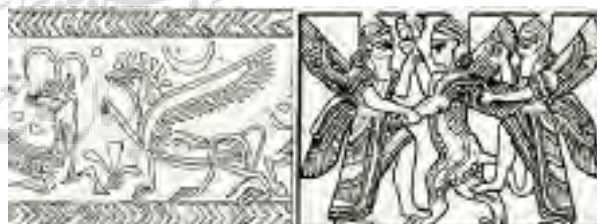
تصویر ۲۲- حسنلو.