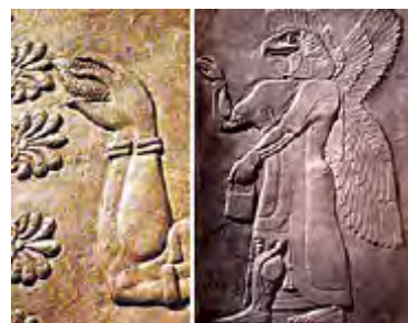
تصویر ۹- آشوری.