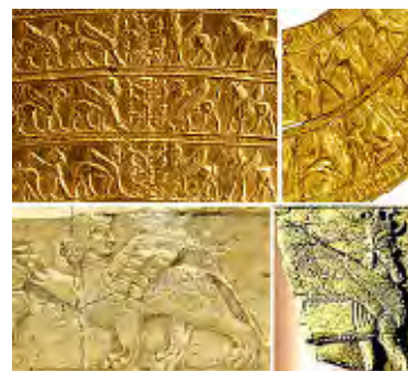
تصویر ۲۳- زیویه.