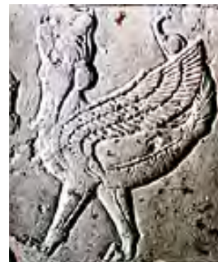
تصویر ۲۴ - زیویه.