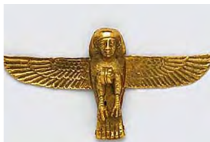
تصویر ۲- با.

از آنجایی که هر گوپت با سر یک فرعون خاص ساخته شده است، شاید بتوان پذیرفت که گوپت‌ها به گونه‌ای نمایانگر «با» برای آن فرعون و نشانه‌ای از زندگی پس از مرگ وی بوده‌اند.