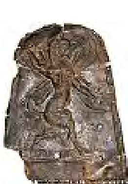
تصویر ۱۹ - کلماکره. ماخذ: (موزه ملی ایران)