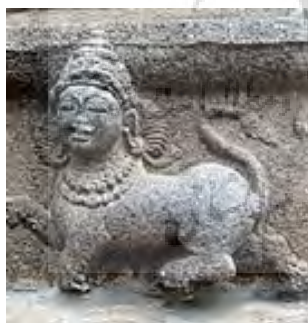
تصویر ۳۸- ناراسیما.