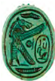
تصویر ۱- سخمخت.