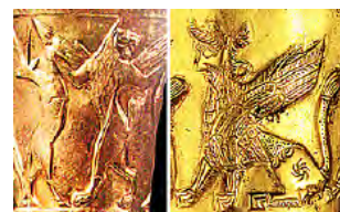
تصویر ۲۷ - عمارلو (راست) و املش (چپ).