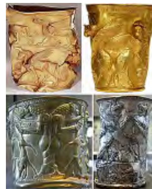
تصویر ۲۶ - مارلیک.