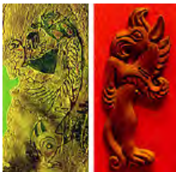
تصویر ۳۱ - پازیریک.