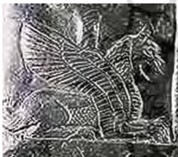
تصویر ۱۸ - کاسی.

بر یک سینی سیمین از کلماکره دو گویت نر بر روی سر دو گویت ماده ترسیم شده‌اند. شیردالی با چهار بال زینت‌گر یک لوح برنزی کلماکره است (تصویر ۱۹). بر یک لگام مفرغین مردی در