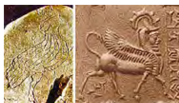
تصویر ۱۷ - عیلامی.