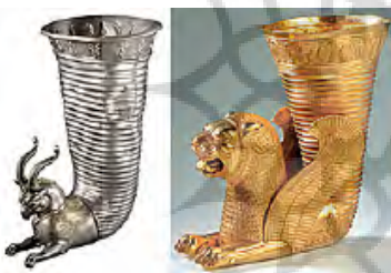
تصویر ۲۹ - هخامنشی.