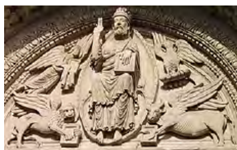
تصویر ۱۲- چهار انجیل نگار.