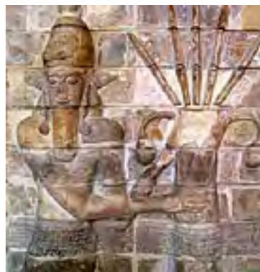
تصویر ۱۵ - شوش.