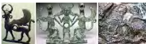
تصویر ۲۰ - لرستان.