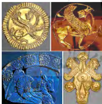
تصویر ۳۰ - هخامنشی.