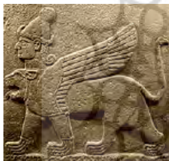
تصویر ۱۴- نوهیتی.