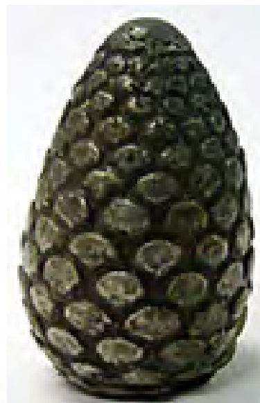
تصویر ۲۱- کلماکره.

۶-۲-۴. شمال مرکزی ایران: در هنر شمال مرکزی ایران در ابتدای هزاره نخست پ.م گوپت‌ها و شیردال‌ها با چیره دستی و شکوه بسیار بر روی جام‌های زرین دیده می‌شوند. تکوک زرینی از مارلیک با نقش چهار گاو بالدار که در برابر درخت زندگی ایستاده‌اند آذین شده. بر جام دیگری از مارلیک یک ردیف شیردال بر فراز یک ردیف گاو بالدار در حرکتند. یک جام زرین دیگر دو شیردال غران را بر سر جنازه چند