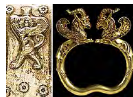
تصویر ۳۲- گنجینه آموی.

برخی از پژوهشگران از چیستان دیگری نیز یاد کرده اند. کدام دو خواهرند که هر یک از درون دیگری زاده می‌شوند. پاسخ شب و روز است که در یونانی هر دو واژه مادینه اند (Grimal, 1996, 324). اسفینکس در پایان خود را از صخره ای که بر آن ایستاده بود فرو می‌افکند و می‌میرد. اودیپوس را نماد گذار از دین کهن یونانی به دین نو (پرستش خدایان المپی) دانسته اند.