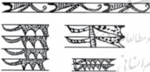
تصویر ۲- نقوش حیوانی لایه ج دوره اول حصار. ماخذ: (Shmidt, 1937, 111)