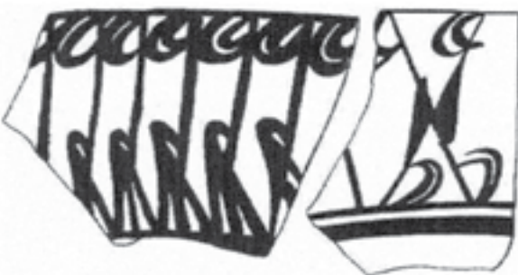
تصویر ۳- نقوش حیوانی لایه الف دوره دوم حصار.

بهره گرفته شده است. در لایه ب نقوش گیاهی، حیوانی و انسانی، بر نقوش هندسی تداوم یافته از لایه الف اضافه شده و با شیوه طبیعت‌گرا طراحی شده‌اند (تصویر ۱). در لایه ج نقوش هندسی همچنان کاربرد دارد؛ ولی نقوش گیاهان، پرندگان و انسان از بین رفته است.