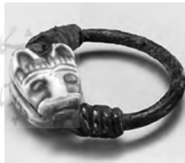
تصویر ۳۸- تبس.

در یک نگاره مصری خدایانو هاتور (یا شاید کادش) مثل ایزدبانوان ایرانی و میانرودانی بر پشت شیر تصویر شده است. شیران نگاهبانی نیز از آستانه گورستان های مصری یافت شده اند، از جمله نمونه ای از دوره هخامنشی در سقاره (تصویر ۳۶). از هورمهب فرعون مصر (۱۳۰۰ پ.م) حلقه ای زرین با نقش شیر باقی مانده (تصویر ۳۷)، انگشتری دیگری نیز با نقش شیر محافظ از تبس ۱۵۰۰ پ.م یافت شده (تصویر ۳۸).