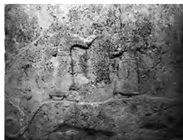
تصویر ۳۹- هیتی.