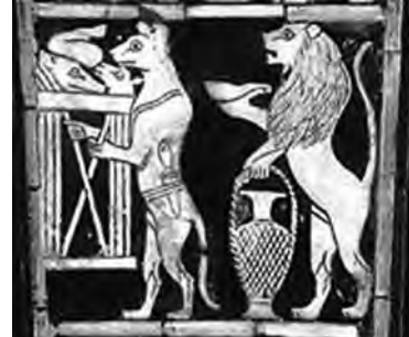
تصویر ۲۸- اور.