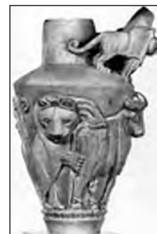
تصویر ۵۱- اوروک.