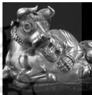
تصویر ۴۸- قالیچی؟