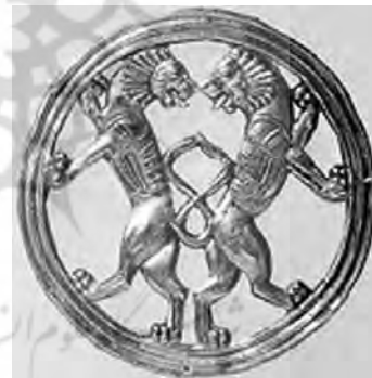
تصویر ۱۸- هخامنشی.