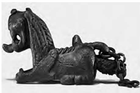
تصویر ۱۱- حسنلو.