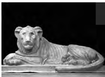
تصویر ۳۶- سقاره. ماخذ: (موزه لوور)