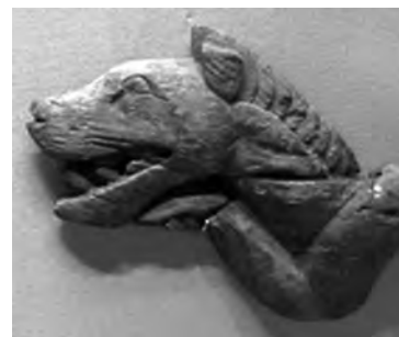
تصویر ۱۳- پازیریک. ماخذ: (موزه هرمیتاژ)