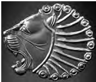
تصویر ۲۳- هخامنشی. ماخذ: (موزه بروکلین)