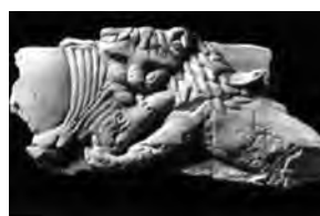
تصویر ۵۴- آشور. ماخذ: (Hermann, 1986: 694)