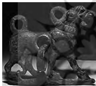
تصویر ۸- لرستان.

در بسیاری از مهر‌آوه‌ها تندیس‌ها از موجودی شیرسر یافت شده که ماری به دور او پیچیده است (تصویر ۴). از او در کتیبه‌ها ۴۴ نام آریمانوس یاد شده که شاید همان اهریمن باشد (Jack-son, 1985, 17). درحالی که برخی پژوهشگران او را آیون (زروان یا کرونوس) می‌دانند دیگران بر اهریمن بودن وی تکیه دارند (Barnett, 1975, 467). گرچه هویت راستین این انگاره هنوز در ابهام است اما بسیاری از مهرپژوهان او را با زمان و تغییر فصل‌ها مرتبط دانسته‌اند (Beck, 2004, 194).