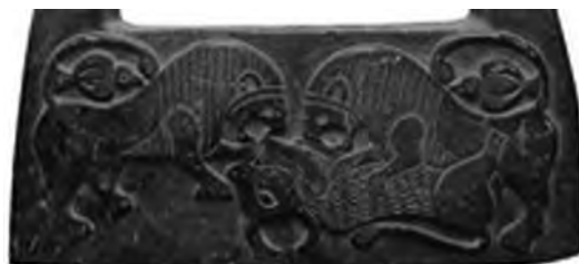
تصویر ۴۵- جیرفت.

در حقیقت در هزاره نخست پ.م، خورشید در فروردین در برج گاو خانه داشته است. اگر ارتباط شیر با خورشید را بپذیریم، می‌توان نشستن شیر بر پشت گاو را رمزی از ورود خورشید به برج ثور و رسیدن نوروز در سرزمین ایران دانست. از این رو نقش کردن این نگاره در پارسه که جایگاه برپایی جشن نوروز بوده است بایسته می‌نماید.