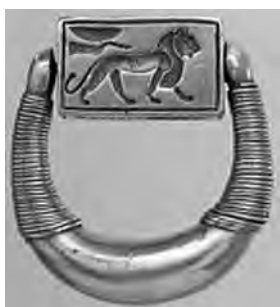
تصویر ۳۷- حلقه هورمهب.