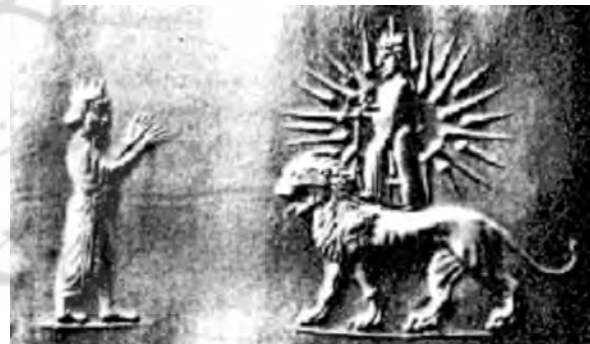
تصویر ۴۲ - هخامنشی؟