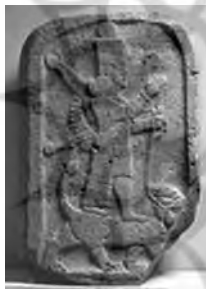
تصویر ۲۴- ایشتار.