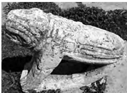
تصویر ۱ - تندیس شیر، گورستانی در اینه.

۱-۴. شیر در آیین مهر: در میان هفت رده دین مهر، چهارمین جایگاه از آن شیر است (Clauss, 2000, 132). به سرشت آتشین شیر در اندیشه مهری نیز اشاره شده است. آب و آتش با یکدیگر مبارزه ای مدام و آشتی ناپذیر دارند. پس سالکانی که به جایگاه شیر رسیده اند برای شست و شوی بدن (غسل تعمید) خود به جای آب عسل به کار می برند (ورمانن، ۱۳۸۳، ۷۵).