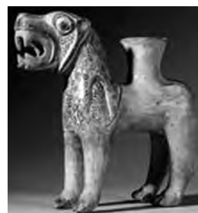
تصویر ۳۰- بابل.

همین رخداد در ایران نیز قابل پیگیری است. میترا (میتره هر سپیده دم خورشید را با گردونه ای چهار اسبه به آسمان می آورد. در مهر یشت آمده: اوست نخستین ایزد مینوی که پیش از خورشید فناپذیر تیز اسب در بالای کوه هرا بر می آید (مهر یشت، کرده ۳، بند ۱۳). مهر یشت در نیایش مهر و خورشید را برای خورشید نگاشته شده است. اما به تدریج مهر و خورشید را همسان پنداشته اند.