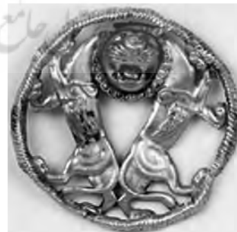
تصویر ۱۹- هخامنشی.