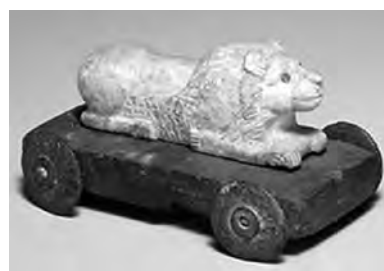
تصویر ۶- ایلامی.