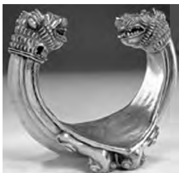
تصویر ۱۰- مارلیک.

در بسیاری از مهر‌آوه‌ها تندیس‌ها از موجودی شیرسر یافت شده که ماری به دور او پیچیده است (تصویر ۴). از او در کتیبه‌ها ۴۴ نام آریمانوس یاد شده که شاید همان اهریمن باشد (Jack-son, 1985, 17). درحالی که برخی پژوهشگران او را آیون (زروان یا کرونوس) می‌دانند دیگران بر اهریمن بودن وی تکیه دارند (Barnett, 1975, 467). گرچه هویت راستین این انگاره هنوز در ابهام است اما بسیاری از مهرپژوهان او را با زمان و تغییر فصل‌ها مرتبط دانسته‌اند (Beck, 2004, 194).