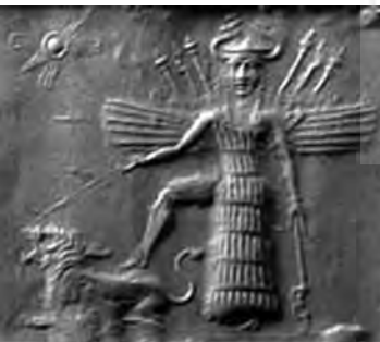
تصویر ۲۶- اینانا.