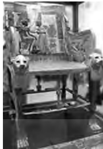
تصویر ۳۳- سریر توت عنخ آمون.