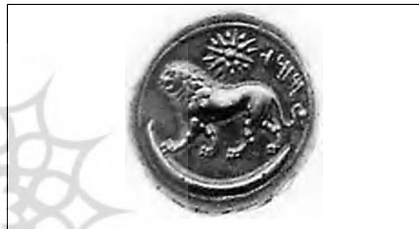
تصویر ۴۱ - مازائوس.

بغبانو به رسم کهن شرقی بر پشت شیری ایستاده و هاله‌ای از پرتوهای خورشید او را در بر گرفته است. این نگاره شاید آغازی بر نشستن خورشید بر دوش شیر در هنر ایرانی باشد. در هنر هزاره نخست پ.م همواره بر ران شیرها مهرانه (گردونه مهر) یا سوآستیکا دیده می‌شود که شاید اشاره‌ای دیگر به ارتباط شیر و خورشید باشد. از جمله بر جام‌های عمارلو، حسنلو و کلاردشت.