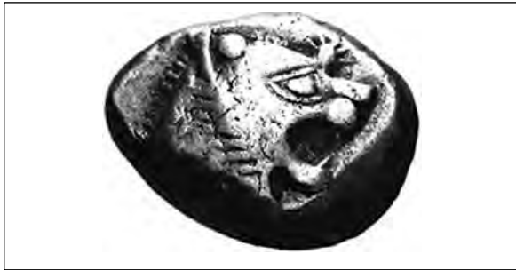
تصویر ۴- لیدی.