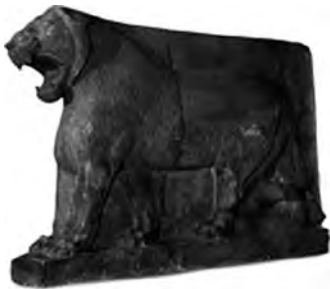
تصویر ۲۵- دروازه ایشتار.