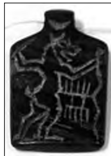
تصویر ۳- ایلامی.