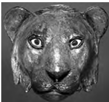
تصویر ۲۷- اور.