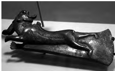
تصویر ۷- لرستان.