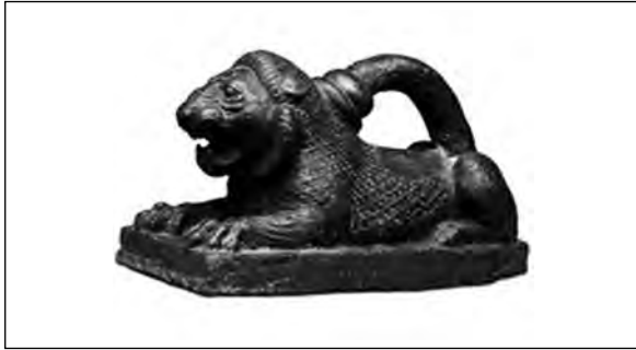
تصویر ۲۱- هخامنشی.

شمس خدای خورشید بابلیان گاه به صورت شیر نمایش داده می‌شده است (Krappe, 1945, 150). اسرحدون پادشاه آشوری شیری سنگی به نیایشگاه شمش هدیه کرده است. شمش در اندیشه میانرودانی ساکن خورشید است، بعدها این خدا با خورشید یکی انگاشته می‌شود و واژه شمس در زبان عربی بازمانده این ترکیب است.