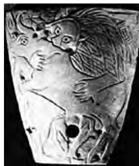
تصویر ۵۲- سومر. ماخذ: (رضی، ۱۳۷۱، ۵۶)