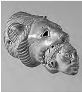
تصویر ۳۲- غلبه شیر بر نوبی.