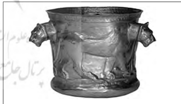
تصویر ۱۲- کلاردشت.

بر دور جام زرین کلاردشت سه شیر چرخان دیده می شوند (تصویر ۱۲). در میانه هزاره نخست پ.م در شمال شرق ایران نیز شیر در آثار گنجینه پازیریک (تصویر ۱۳) حضور دارد. شیر از مهم ترین نمادهای هنر هخامنشی است. تخت شاه همواره پایه هایی بسان پنجه شیر دارد. تخت بزرگی که نمایندگان ساتراپی ها در سنگ نگاره های نقش رستم به دوش دارد نیز چنین است. بر دیوارهای آپادانای شوش یک ردیف شیر غران نقش شده اند (تصویر ۱۴). شیرهای سنگی نگهبان در پارسه نیز حضور داشته اند (تصویر ۱۵). شمشیر زرین شاهی دسته ای از سر دو شیر دارد (تصویر ۱۶) و زیباترین تکوک های هخامنشی از پیکر شیر شکل گرفته اند (تصویر ۱۷). رویارویی دو شیر خشمگین از نمادهای رایج این دوران است (تصویر ۱۸). در یک نمونه بسیار کمیاب سر دو شیر به هم پیوسته و یکی شده است (تصویر ۱۹). یک اثر مفرغی دیگر سه شیر چرخان و چسبیده به هم را تصویر می کند (تصویر ۲۰). شیرهای مفرغی کاربرد وزنه نیز داشته اند. یک نمونه یافت شده از ساتراپی لیدییه حدود ۲۱ کیلوگرم (نزدیک به یک تالنت بابلی) وزن دارد (تصویر ۲۱). شیر را بسان محافظ بر دستبندها، گردن آویزهای سنگی (تصویر ۲۲)، و آذین های لباس (تصویر ۲۳) دوران هخامنشی نیز می توان دید.