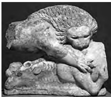
تصویر ۵۵- یونان.