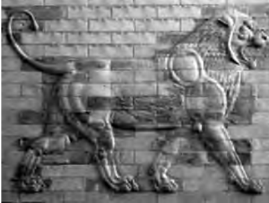
تصویر ۴- هخامنشی.

بازوبند زرینی از مارلیک (ابتدای هزاره نخست پ.م) با سر دو شیر خشمگین آذین یافته (تصویر ۱۰). در همین دوران شیر در عاج کندهای زیویه نیز دیده می شود. بر جام حسنلو دو شیر نقش شده، یکی خوابیده که اژدها و مردی بر دوش دارد و دیگری که ایزدبانویی را بر دوش خود نشانده. در آثار مفرغین حسنلو نیز شیر بارها تصویر گردیده (تصویر ۱۱).