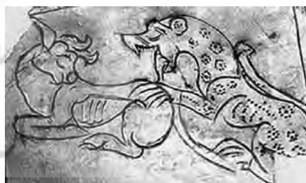
تصویر ۴۹- کردستان.