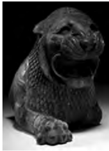
تصویر ۱۵- هخامنشی.