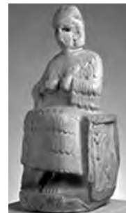
تصویر ۲- ایلامی.

مولانا نیز زمان را به گونه شیر توصیف می‌کند: یکی شیری همی بینم جهان پیشش گله‌ی آهو که من این شیر و آهو را نمی دانم نمی دانم زمین چون زن فلک چون شو خورند فرزند چون گربه من این زن را و این شو را نمی دانم نمی دانم اشاره مولانا به خورده شدن فرزند نیز اسطوره یونانی کرونوس خدای زمان را به یاد می‌آورد.