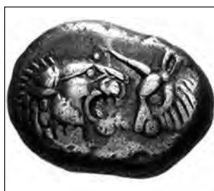
تصویر ۵۶- لیدی.