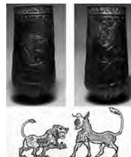
تصویر ۴۷- لرستان.