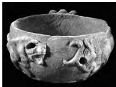
تصویر ۴۶- شوش.