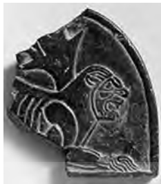
تصویر ۲۲- هخامنشی.