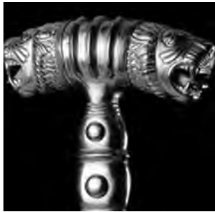
تصویر ۱۶- هخامنشی.