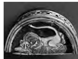
تصویر ۵۳- اور.