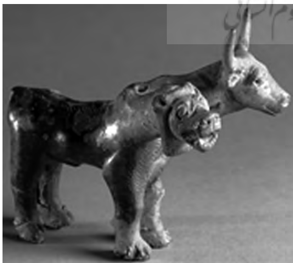
تصویر ۴۴ - غرب ایران. ماخذ: (موزه کلیولند)

در هنر میانرودان نیز نقش شیر گاو اوژن رایج است. این بن‌مایه را می‌توان بر یک جام از اوروک (تصویر ۵۱)، یک آویز زینتی سومری (تصویر ۵۲)، عاجی سنگ نگاری شده