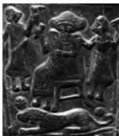
تصویر ۹- لرستان.