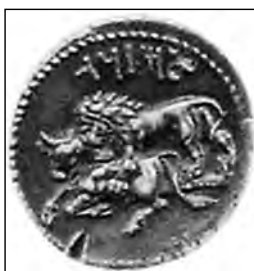
تصویر ۵۷- مازانوس.