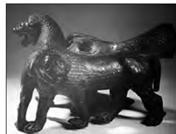
تصویر ۲۰- هخامنشی. ماخذ: (Curtis, 2005, 103)