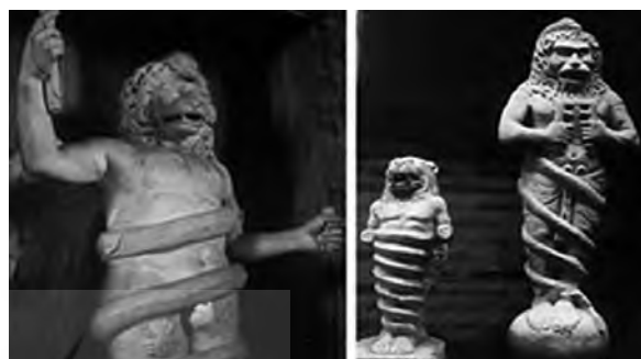
تصویر ۴- خدای شیرسر مهری. ماخذ: (موزه واتیکان)

مولانا نیز زمان را به گونه شیر توصیف می‌کند: یکی شیری همی بینم جهان پیشش گله‌ی آهو که من این شیر و آهو را نمی دانم نمی دانم زمین چون زن فلک چون شو خورند فرزند چون گربه من این زن را و این شو را نمی دانم نمی دانم اشاره مولانا به خورده شدن فرزند نیز اسطوره یونانی کرونوس خدای زمان را به یاد می‌آورد.