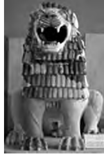
تصویر ۳۱- آشور.