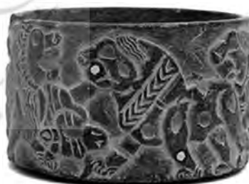
تصویر ۵- جیرفت.