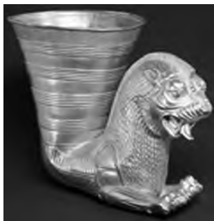
تصویر ۱۷- هخامنشی.

بر دور جام زرین کلاردشت سه شیر چرخان دیده می شوند (تصویر ۱۲). در میانه هزاره نخست پ.م در شمال شرق ایران نیز شیر در آثار گنجینه پازیریک (تصویر ۱۳) حضور دارد. شیر از مهم ترین نمادهای هنر هخامنشی است. تخت شاه همواره پایه هایی بسان پنجه شیر دارد. تخت بزرگی که نمایندگان ساتراپی ها در سنگ نگاره های نقش رستم به دوش دارد نیز چنین است. بر دیوارهای آپادانای شوش یک ردیف شیر غران نقش شده اند (تصویر ۱۴). شیرهای سنگی نگهبان در پارسه نیز حضور داشته اند (تصویر ۱۵). شمشیر زرین شاهی دسته ای از سر دو شیر دارد (تصویر ۱۶) و زیباترین تکوک های هخامنشی از پیکر شیر شکل گرفته اند (تصویر ۱۷). رویارویی دو شیر خشمگین از نمادهای رایج این دوران است (تصویر ۱۸). در یک نمونه بسیار کمیاب سر دو شیر به هم پیوسته و یکی شده است (تصویر ۱۹). یک اثر مفرغی دیگر سه شیر چرخان و چسبیده به هم را تصویر می کند (تصویر ۲۰). شیرهای مفرغی کاربرد وزنه نیز داشته اند. یک نمونه یافت شده از ساتراپی لیدییه حدود ۲۱ کیلوگرم (نزدیک به یک تالنت بابلی) وزن دارد (تصویر ۲۱). شیر را بسان محافظ بر دستبندها، گردن آویزهای سنگی (تصویر ۲۲)، و آذین های لباس (تصویر ۲۳) دوران هخامنشی نیز می توان دید.