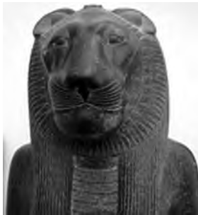
تصویر ۳۴- سحمت.