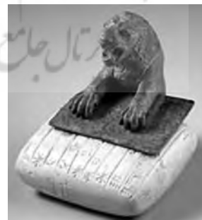
تصویر ۲۹- اور.