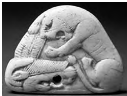
تصویر ۵۰- هخامنشی.