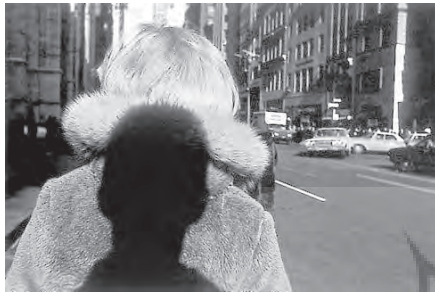
تصویر ۷- لی فریدلندر خودنگار، ۱۹۶۶.