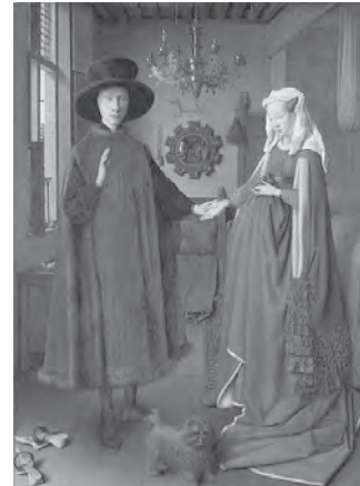
تصویر ۱- یان وان ایک الفینی و نوعروسش، ۱۶۳۴ م.