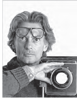
تصویر ۵- ریچارد اودون خودنگار، ۱۹۷۸.

مؤنث نقش بسته است. هر گونه خوانش فراتر از متن و هر گونه مدلولی را می‌توان از این دال تصور کرد. خوانشی کلیشه‌ای یا استودیومی (حاصل از متن فیلم‌های پلیسی)، احتمالاً از تحت نظر بودن و یا عدم امنیت زن یا در تعقیب بودن او توسط سایه‌ای سیاه و سنگین را رقم می‌زند. یا اگر معنایی مثبت از سوی مخاطب به متن این عکس تحمیل کرد، هرچند که با ترکیب بندی ساختار بصری و فرهنگ و تفکرات مردمان اروپایی نامأنوس است، اما با توسل به مفهوم شعر مولانا ۲ ، مخاطب یا هر کسی از ظن خود عکس را تفسیر کند و در آن صورت شاید بتوان با توجه به فرهنگ ایرانی گفت که "سایه مرد" دال بر "حمایت و پشتیبانی مرد از زن" است.