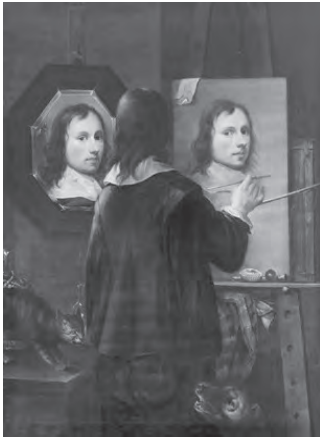
تصویر ۳- یوهانس گامپ اخودنگاره، ۱۶۴۶.