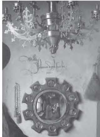
تصویر ۲- جزعی از تصویر ۱- امضای یان وان ایک در میانه اثر در بالای آیینه.