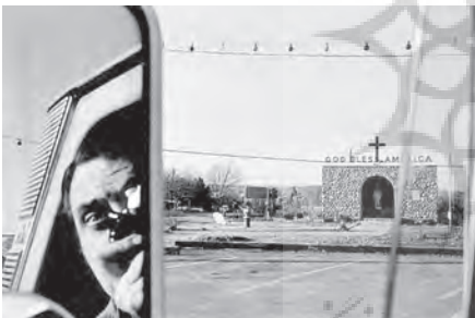
تصویر ۸- لی فریدلندر خودنگار، جاده غربی، نیویورک، ۱۹۶۷.

در این تصویر مشاهده می‌شود که مؤلف از خود سایه‌ای غیرمستقیم و مبهم باقی گذاشته است اما اگر همان سایه مبهم مؤلف حذف شود، به معنای متکثر تصویر آسیب خواهد رساند. به ویژه زیبایی ابهام در این متن را از بین خواهد برد متنی که به تعبیر بارت از نوع نویسا نیست زیرا به مخاطب اجازه می‌دهد لذت مؤلف بودن را تجربه کند و به متنی از نوع نویسنده نزدیک شود و مدام تعبیری جدید از عکس را مطابق فرهنگ و خوانش خود ارائه دهد. اما تمامی این لذت معناپردازی، مغایرتی با حضور سایه مؤلف ندارد بلکه در سایه مؤلف این معناسازی‌ها شکل می‌گیرد.