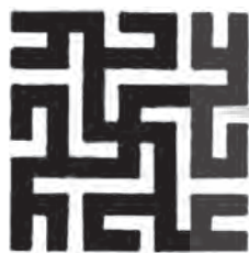
تصویر ۲- نقش چلیپا با نام علی (ع)- مسجد جامع اصفهان.

و سپس به دیگر جاها رفته است حتی از اسپانیا تا چین، رومانی تا بین‌النهرین همه جا این نشانه همراه با محرابه‌ها و یادمان‌های دیگر مهری بدست آمده، ولی وقتی این نشان را در میان سرخپوستان امریکا از روزگاران پیش می‌بینیم نمی‌توان پنداشت که فقط با کیش مهری که چلیپا از ویژگی‌ها ییش بوده به یونان و رم رفته، بلکه با پراکندگی آریاها به همه سرزمین‌ها راه یافته است و در واقع کیش مهری زندگی نوینی بدان بخشیده، درست است که در کیش مهر چلیپا نمادی بزرگ بوده و پیروان این کیش آن را برپیشانی، دست یا رخت خود به نشانه شناسایی و سرسپردگی می‌کشیدند، اما این نماد تنها با آئین مهر و مسیحیت بستگی ندارد و پیش از آن، در پهنه جهان در خور ارج و بزرگداشت بوده. پس از مسیح هم چلیپا دارای نیروی پنهانی و اسرار آمیز بوده و بکار رفته است. پس از پیدایش دین مبین اسلام و حمله به ایران، بسیاری از اندیشه‌ها و فرهنگ‌ها و پندارها به دیگر کشورهای اسلامی راه یافت. چلیپا نیز در این دوره زندگی جدیدی را آغاز کرد و معنا و مفهوم جدیدی یافته و به کار آمد. در کشورهای اسلامی به ویژه ایران، با این نگاره- شبکه پر دامنه و گسترده‌ای با نام الله، محمد، علی- مسجدها و نیایشگاه‌ها را زینت بخشیده‌اند (تصویر ۲).