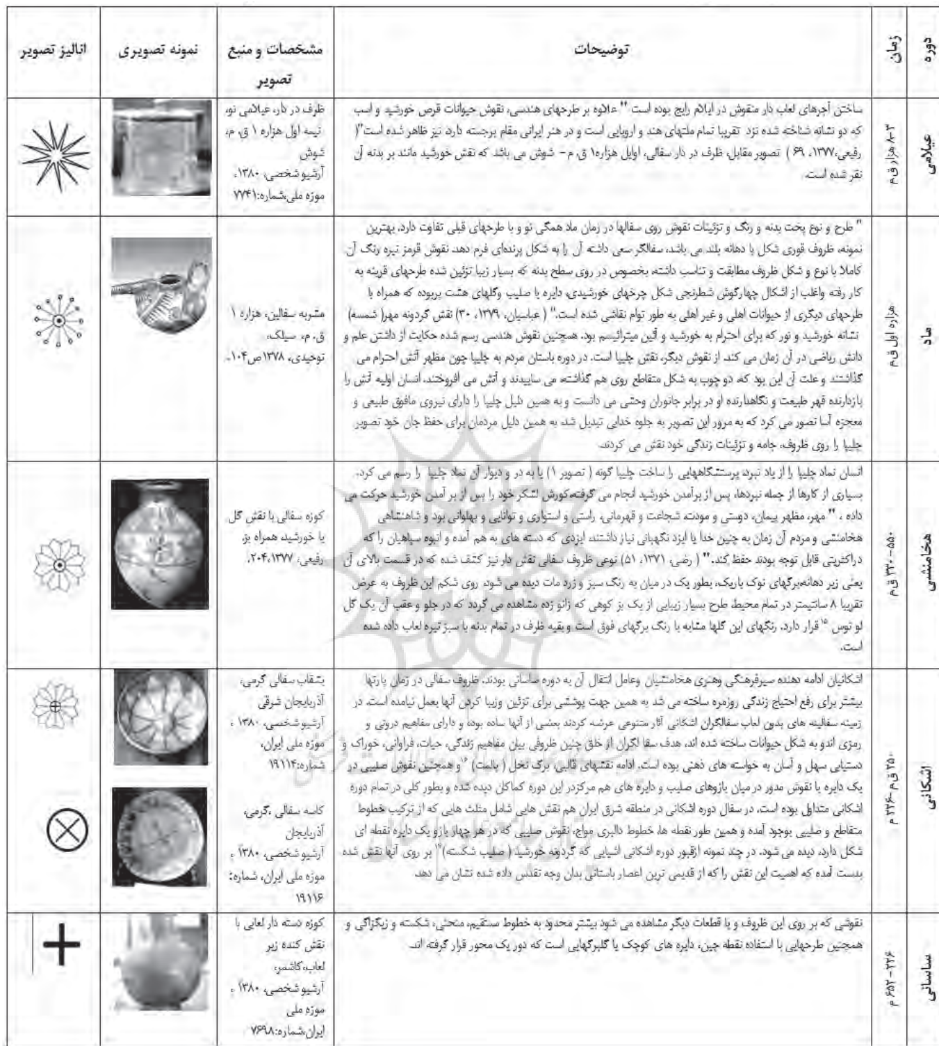
جدول ۳- بررسی نقش خورشید و چلیپا بر سفالینه های ایرانی در دوره های مختلف تاریخی، قبل از اسلام.