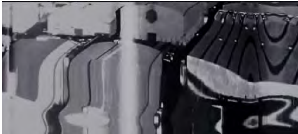
تصویر ۶- بهره‌گیری از اختلال زبانی در فیلم تلقین در قالب اعوجاج و دگردیسی تصویر.