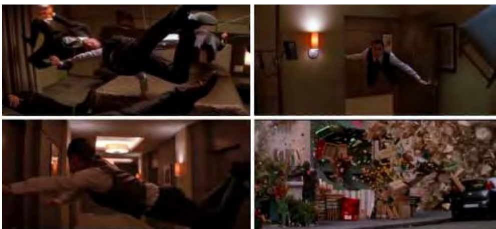
تصویر ۷- بهره‌گیری از اختلال زبانی در فیلم تلقین در قالب نادیده‌گرفتن نیروی جاذبه.

می‌کند که در حال دیدن فیلم و در دنیای تخیل و رؤیا است و هیچ تلاشی در پنهان‌سازی رابطه ساختگی بین داستان و واقعیت نمی‌کند؛ و این بسته به درک و فهم بیننده است که تا چه اندازه متوجه این آشکارسازی شود. مثلاً در هر مرحله و لایه از خواب هرگاه دام‌کاب و گروهش قصد نفوذ به لایه‌ای عمیق‌تر را دارند، این دیالوگ تکرار می‌شود: «باید به خواب برویم». یا جمله: «خواب‌های خوش ببینید!».