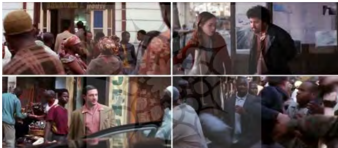
تصویر ۳- توجه به خرده فرهنگ‌ها در فیلم تلقین در قالب نژاد کنیایی (یوسف) و عناصر معماری کنیایی (شهر مومباسا).

ما به واقعیتی می‌شود که سالیان درازی به سبب زندگی مدرن از فقدان آن غافل شده‌ایم و بازسازی آن بسی دشوار است. این خود وجهی از پُست‌مدرنیسم است که درصدد بازگشت به دنیای پیش از مدرن را دارد. ۲. توتم نقش حمایتی از انسان‌ها را دارد و فرشته حامی و نگهبان آنهاست. حمایت از موجودات انسانی در برابر خشم و اقتدار خدایان و شیاطین، حفظ کسانی که با مرده تماس داشته‌اند و پیشگیری از اختلالاتی که به هنگام تحقق پاره‌ای از اعمال بزرگ زندگی، ممکن است پیش بیاید (همان). گویا نقش توتم در فیلم تلقین با کارکردهایی که فروید برای آن در نظر گرفته است منطبق است. توتم برای دام‌کاب، آرتور و آریادنی در نقش شیء نمادین است که می‌بایست آن را همیشه به همراه داشته باشند، کسی غیر از همان فرد آن را لمس نکند وگرنه خاصیت جادویی خود را از دست می‌دهد و از همه مهم‌تر نقش حمایتی که برای آنها ایفا می‌کند. به‌قول آریادنی: «راه‌حل ظریفی برای تشخیص واقعیت از رؤیا». یا به قول دام‌کاب: «برای اینکه مطمئن شوی که داخل حافظه شخص دیگری نیستی» (تصویر ۴).