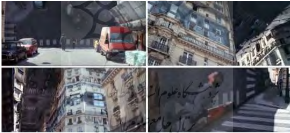
تصویر ۵- بهره‌گیری از اختلال زبانی در فیلم تلقین در قالب تغییر غیرمنتظره زاویه دوربین.

از دیگر نمونه‌های رد تقابلی‌های دوتایی در فیلم تلقین، علاوه بر لغو نژادپرستی، می‌توان لغو دیدگاه مردسالارانه دانست. این فیلم برخلاف دیدگاه‌های مردسالارانه گذشته که زنان را در حد یک عنصر منفعل در نظر می‌گرفت، خارج شده و زن به عنوان شخصیتی مهم و تأثیرگذار مطرح می‌شود. در فیلم تلقین، آریادنی زنی است که به دلیل عدم توانایی و لیاقت طراح قبلی (مردی به نام ایمز) و به سبب هوش بالایی که دارد، جایگزین ایمز شده و به عنوان برنامه‌ریز عملیات و طراح و معمار هزارتوهای عجیب‌وغریبی که قرار است بعداً دام‌کاب و گروهش در آن حضور پیدا کنند، به گروه می‌پیوندد. او همگام و برابر با دیگر شخصیت‌های مرد در داستان و صحنه ظاهر می‌شود و نقشی صرفاً منفعل ندارد. بنابراین فیلم تلقین عملاً بنیان‌های نظری برتری جنسی مردسالارانه را نقض می‌کند.