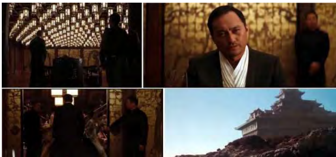
تصویر ۲- توجه به خرده فرهنگ‌ها در فیلم تلقین در قالب نژاد ژاپنی (آقای ساتیو) و عناصر معماری ژاپنی.