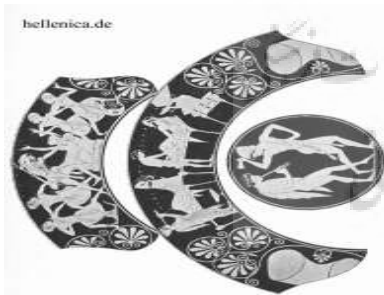
تصویر ۲- جام آتنی متعلق به ۵۲۵ تا ۴۷۵ پیش از میلاد که در موزه لندن نگهداری می‌شود.

با بررسی فیلم‌های آثار استانیوسکی به‌ویژه آثار یونانی او (الکترا، ایفی ژنیا، متامورفوسیس) درمی‌یابیم که بسیاری از حرکات موجود در این نمایش‌ها برگرفته از شمایل‌نگاری موجود روی ظروف، و به‌ویژه گلدان‌های «دوره‌های هندسی یونان (۸۰۰ تا ۱۱۰۰ ق.م) تا دوره‌های متاخر هلنیستی» ۶۵ یونانی است. یک بیننده با تجربه که تصاویر ظروف یونانی را بخاطر دارد بخوبی قادر به شناخت منبع الهامات حرکت‌ها و رقص‌های سریع و نفس‌گیر گروه گارجنیدزه خواهد بود. در اینجا توجه شما را به نمونه‌ای از این ظروف و نقوشی که هم اینک در موزه‌های لوور پاریس، فلورانس و موزه لندن قرار دارند جلب می‌کنیم.