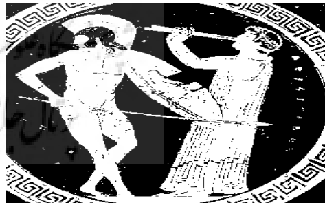
تصویر ۲- رقص جنگ متعلق به سال ۴۹۰ قبل از میلاد که در موزه لوور پاریس نگهداری می‌شود.