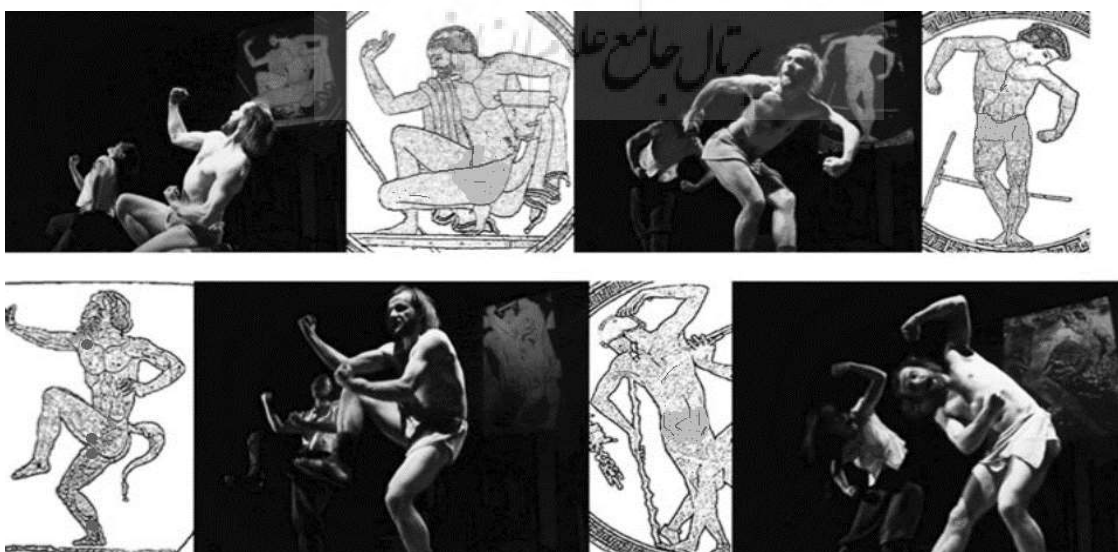
تصویر ۱- تصاویری از ساخت هیرونومیا از روی نقوش ظروف باستانی توسط بازیگران. مأخذ: (Macintosh, 2010, 401)

آیلت دیکل ۵۷ در مقاله‌ای با عنوان «نقب‌زدن به عمق درام» ۵۸ در مورد شیوه تئاتر استانیوسکی و نقش هیرونومیا در تئاتر وی می‌گوید که: «او یک روش آموزشی ایجاد کرده است که نیاز به درگیری و دخالت کامل بدن دارد: تنفس، صدا و حرکت. علاوه بر این، او عناصری