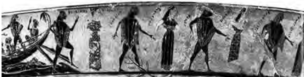
تصویر ۴- رقص کرین از تسوس و جوانان آتنی هنگام فرار از کرت متعلق به سال ۵۷۰ قبل از میلاد که در موزه فلورانس نگهداری می‌شود.