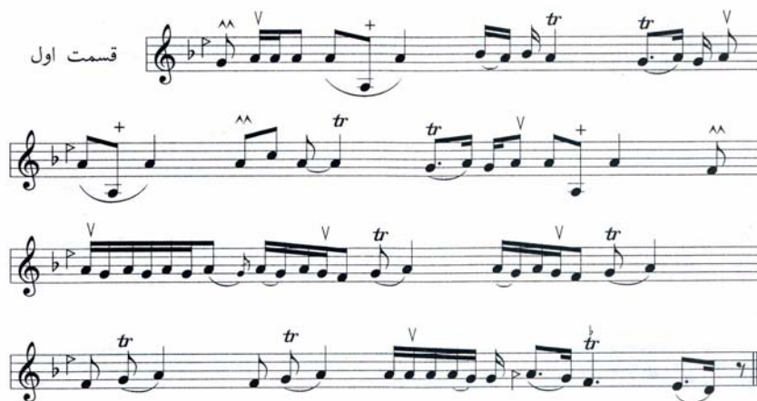
تصویر ۱۱- قسمت اول آواز بیات کرد ردیف میرزا حسین قلی. ماخذ: (آوانگاری داریوش پیرنیاکان، ۱۳۸۸، ۹۷)