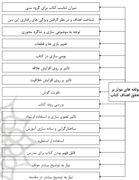
نمودار ۱- ریزکدهای استخراج شده از مصاحبه ها.

انجام می شود و به نظریه پرداز کمک می کند تا فرایند نظریه پردازی را به سهولت انجام دهد. کدگذاری انتخابی عبارت است از فرآیند انتخاب دسته بندی اصلی، مرتبط کردن نظام مند آن با دیگر دسته بندی ها، تأیید اعتبار این روابط، و تکمیل دسته بندی هایی که نیاز به اصلاح و توسعه بیشتری دارند (Strauss & Corbin, 1990). کدگذاری انتخابی، بر اساس نتایج کدگذاری باز و کدگذاری