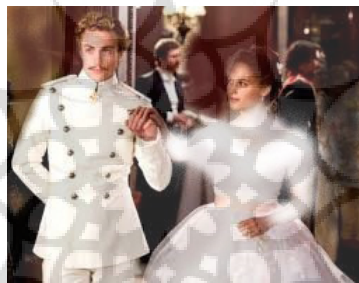
تصویر ۲- کنت ورونسکی و نامزدش.