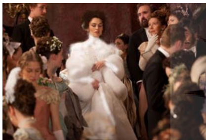
تصویر ۳- آنا در مهمانی.

در ادامه فیلم، لباس آنا از آنجایی که ناراضی از روابط زناشویی و همچنین دارای حس گناه نسبت به روابطش با کنت ورونسکی است، همچنان تیره است. ولی پس از آن، در صحنه‌هایی که آنا عشقش به کنت ورونسکی را آشکار کرده است و به دلیل اینکه می‌خواهد در نظر