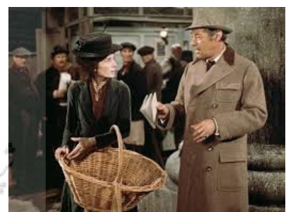
تصویر ۱۰- سکانس آغازین.