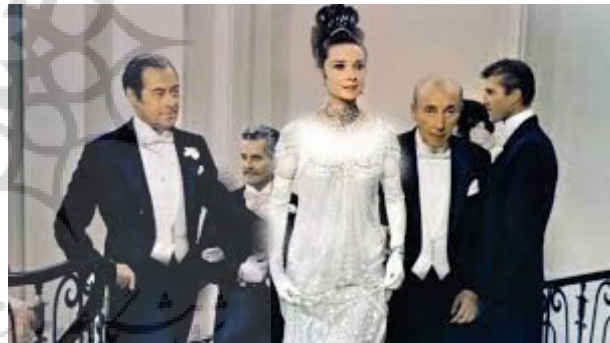
تصویر ۱۵- سکانس پایانی.

همانطور که سیاهی و سفیدی، چه از منظر روان‌شناسی و چه از نظر زیباشناسی و بصری، در دو نقطه مقابل یکدیگر قرار دارند، در فیلم آناکارینا ، شخصیت‌های مثبت و منفی داستان در جایی که در مقابل یکدیگر قرار دارند، دارای پوشش و لباس سفید و مشکی می‌شوند. در فیلم بانوی زیبای من ، بازیگر اصلی در حال نبرد درونی و یا تحول شخصیتی است و روند از تیرگی به روشنایی، نشانگر رو به مثبت رفتن و پیشرفت شخصیتی و رفتاری وی است. در نتیجه در هر صحنه‌ای از فیلم که تضاد شخصیتی بازیگران و یا یک بازیگر با خودش به تصویر کشیده می‌شود، رنگ سیاه و سفید لباس، نقش مهمی را ایفا می‌کند. به نظر می‌رسد با توجه به نظریه‌ی بارت؛ هر کدام از عناصر سیاه و سفید به تنهایی معنایی