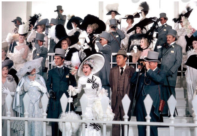
تصویر ۱۴- صحنه‌ی اسب دوانی.