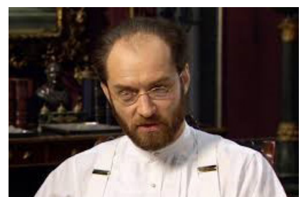
تصویر ۷- الکسی کارنین.