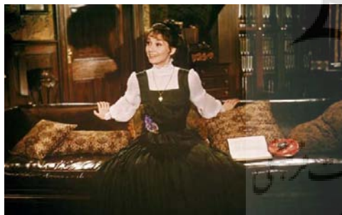
تصویر ۱۲- الیزا: تصویر از نگارنده برگرفته از فیلم

همانطور که گفته شد، لباس در کارکرد رسانه‌ای خود، بیان را به واسطه‌ی رنگ، نقش ها و نقش مایه‌ها و همین طور نقش مایه‌های زبانی نوشتار روی لباس (ممکن می سازد؛ از این رو شناخت چنین