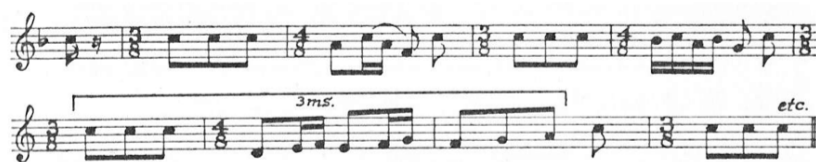
تصویر ۲- سمفونی شماره ۶ مالر، موومان دوم، میزان ۹۶-۱۰۴. مأخذ: پارتیتور آهنگساز

دوره پایانی (۱۹۰۶ الی ۱۹۱۱): مشتمل بر آثاری نظیر سمفونی‌های هشت، الی ده (ناتمام) و مجموعه ترانه زمین ۱۰ است. مالر در سال‌های آخر زندگی حوادث تلخی را تجربه کرد «اگر بخواهیم در طول سال‌های ۱۹۰۶ و ۱۹۰۷ قلمروهای زندگی شخصی و خلاقیت مالر را از همدیگر جدا نشان دهیم، از سیمایی که در نظر داریم از آهنگساز ترسیم کنیم، یکی از خطوط اصلی و مهم به کنار گذارده می‌شود. روال زندگی مالر در این دو سال مورد بحث، از