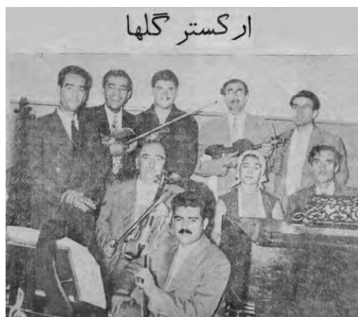
تصویر ۵. صبا و ارکستر او در استودیوی گل‌ها در رادیو ایران، ۱۳۳۶.

استودیوهای قدیمی که خوانندگان و نوازندگان آثار ماندگار خود را در آن‌ها ضبط کرده‌اند برای خود این هنرمندان و علاقه‌مندان به آن آثار همواره بسیار خاطره‌انگیز است. در ایران استودیوهای قدیمی بسیاری هست که بیشتر آن‌ها مربوط به رادیو و تلویزیون ملی ایران است. تعدادی استودیوی خصوصی در ایران هست که اغلب آن‌ها در شهر تهران قرار دارد. تصویر ۵، که در استودیوی گل‌ها در رادیو گرفته شده است، صحنه‌ای به‌یادماندنی از نواهای آن روزگار را توسط ابوالحسن صبا و سایر نوازندگان ارکستر او در سال ۱۳۳۶ به نمایش می‌گذارد.