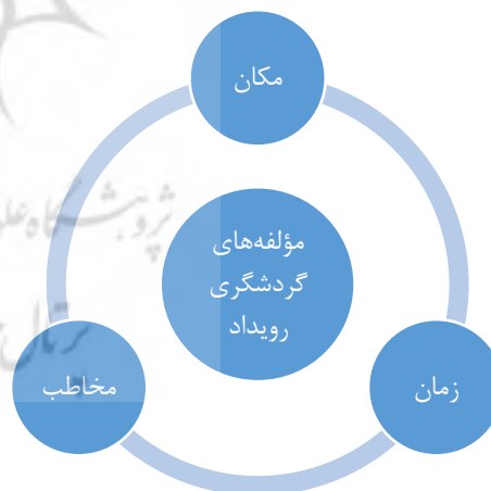
تصویر ۱. سه مؤلفه اصلی در طراحی بسته‌های گردشگری رویداد

مدیریت مراسم و رویدادها مدیریتی تخصصی است و مستلزم توانایی‌های عملی اس؛ بنابراین، داشتن دانش تئوریک برای موفقیت در آن کافی نیست. برای این امر، لازم است تا فرد از یک سو توانایی‌های مدیریتی داشته باشد و از سوی دیگر طبیعت برگزاری چنین رویدادهایی را به‌خوبی بداند.