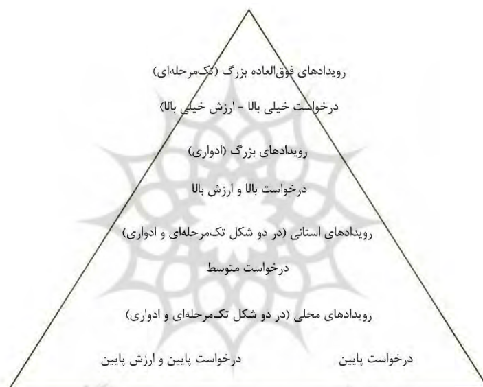
تصویر ۲. هرم انواع رویدادهای گردشگری براساس میزان اهمیت، تناوب تکرار، و بهره‌های اقتصادی.

سهام بازار (آیا تحت تأثیر رویداد برگزار شده بازار سهام ترقی کرده است؟) کیفیت (آیا برنامه اجرایی از نظر مصرف‌کنندگان آن از کیفیت لازم برخوردار بوده است؟) ارتقای تصور ذهنی مصرف‌کننده (آیا تصور ذهنی مخاطب از فرهنگ میزبان ترقی یافته است؟) پشتیبانی تشکلی‌ها (آیا حامیان و تشکلی‌های مشارکت‌کننده از سرمایه‌گذاری خود به رضایت رسیده‌اند؟) ارزش‌های حاصله برای توسعه محیط زیست (آیا تحت تأثیر رویداد اجرایی، محیط زیست مقصد ارتقای کیفی یا کمی یافته است؟)