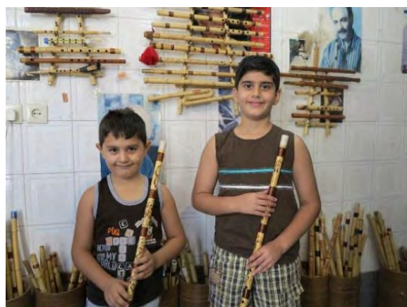
تصویر ۷. گردشگران در حال بازدید از کارگاه خصوصی ساخت سازهای بادی در مرودشت استان فارس. این کارگاه‌ها یکی از جاذبه‌های گردشگری موسیقی در این شهرستان است

سازسازها در اغلب اوقات خود نیز نوازنده‌اند و برای ساخت ساز از ابزارهای محلی استفاده می‌کنند؛ همین امر بازدید از کارگاه‌های آنان را برای گردشگران مهیج‌تر می‌کند. در کشور ما تقریباً در اغلب موارد سازهای محلی در خود منطقه ساخته می‌شوند؛ از همین روی، می‌توان گردشگری سازسازی را یکی از شیوه‌های مؤثر در رونق گردشگری موسیقی و آورده‌های اقتصادی آن برای محل برشمرد.