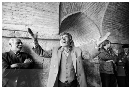
تصویر ۴. آواز خوانندگان حرفه‌ای و آماتور در زیر رواق‌های پل خواجه در اصفهان.

خوانندگان صاحب‌نام و خوانندگان جوان هر دو گروه از رواق‌های ایجادشده در زیر پل‌های خواجه و سی‌وسه‌پل برای خواندن آواز استفاده می‌کرده‌اند. امروزه گردشگران دقیقی را در این رواق‌ها می‌نشینند. این دقایق برای آنان یادآور آوازهایی است که در این مکان خوانده می‌شده است. برخی گردشگران با قرارگرفتن در این فضا خود نیز حال و هوای آواز خواندن پیدا می‌کنند و برای خود آوازهایی زمزمه می‌کنند (تصویر ۴).