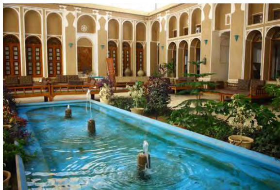
تصویر ۸. خانه مظفر در شهر یزد، از اماکن میراث معماری کویر مرکزی ایران. از آن به‌عنوان اقامتگاه گردشگران استفاده می‌شود.

علاوه بر فضاهایی که اصالتاً در آن‌ها فعالیت‌های موسیقایی شکل می‌گیرد، می‌توان اماکنی را که دارای پتانسیل‌های فرهنگی‌اند برای کاربردهای چندگانه، که اجرا یا آموزش موسیقی یکی از چنین کارکردهایی است، اختصاص داد. از باب نمونه، در مجموعه سعدی، در شهر شیراز، کارگاه‌هایی برای تولید و عرضه صنایع دستی این شهر اختصاص داده شده است که گردشگران این مجموعه، علاوه بر بهره‌مندی از فضای آرامگاه این شاعر نیکوسخن شعر فارسی، از این کارگاه‌ها دیدن می‌کنند.