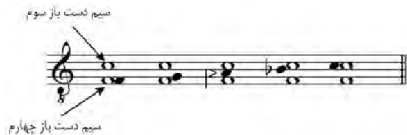
تصویر ۹- ترکیب سیم‌های دست باز با نت‌های ملودی.