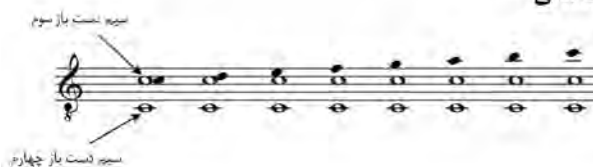
تصویر ۸- ترکیب سیم‌های دست باز سوم و چهارم با نت‌های ملودی بر روی سیم دوم - رجیستر بالا.

این رابطه در اجرای تمامی دستگاه‌ها و آوازهای موسیقی کلاسیک ایرانی در اجرا با ساز سه تار تقریباً بر همین روال است. گاهی سیم‌های دست باز سوم و چهارم دو نت متفاوت هستند