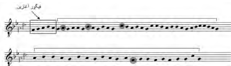
تصویر ۱۱- روند افزایشی و کاهش‌دهنده در گستره صوتی.

اساس شکل‌گیری اشکال‌های صوتی یا مدها از چهار دانگ اصلی یعنی شور، ماهور، دشتی و چهارگاه (طلایی، ۱۳۷۲، ۲۳) ناشی می‌شوند، لذا تغییر نقاط تاکید فضای مدال را نیز تحت تاثیر قرار می‌دهد که با کاهش و افزایش، منطبق بر گردش ملودی پیرامون نقاط ثقل گوشه‌ها همراه است.