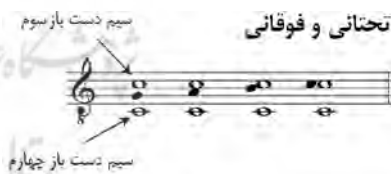
تصویر ۷- ترکیب سیم‌های دست باز سوم و چهارم با نت‌های ملودی بر روی سیم دوم - رجیستر پایین.

تصویر ۷، رابطه عمودی صداها را در حالتی که ملودی روی سیم دوم سه تار اجرا شود، نشان می‌دهد. لازم به ذکر است که در سه تار معمولاً هنگام نواختن روی سیم دوم، سیم سوم و گاهی (با شدت کمتر) چهارم دست باز نیز هم زمان شنیده می‌شوند. در تصاویر ۷ و ۸، روند حرکت نت‌ها روی سیم دوم تا نت دو رابطه فوقانی با سیم دست باز سوم (و تا حدی کمرنگ تر تحتانی با سیم چهارم) داشته و بعد از آن تبدیل به رابطه تحتانی می‌شود.