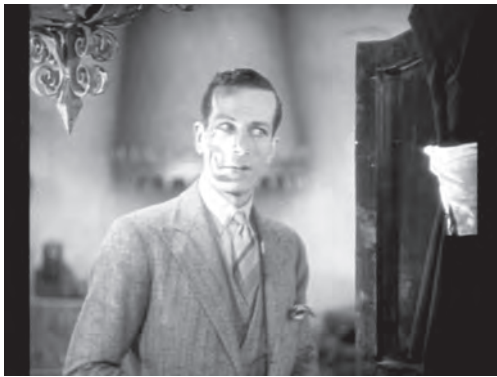
تصویر ۱۷- سایه‌ای شیطانی بر چهره نقاش. ماخذ: (فیلم «حق السکوت»، ۱۹۲۹)

دختر با کشتن نقاش از مهلکه جان سالم به در می‌برد و به خانه باز می‌گردد اما اخبار قتل در همه جا منتشر شده و در نتیجه دختر در تصوراتش طناب دار را به گردن خود می‌بیند و هیچکاک در تصویری به وسیله سایه‌ای که روی گردن و دور صورت وی افتاده این حس وی را به مخاطب منتقل می‌کند.