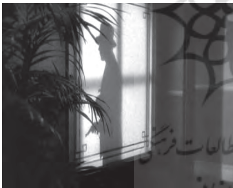
تصویر ۶- سایه «تونی کامونتی» به هنگام شلیک به «لوئی کاستلو».

گانگسترند اما در عین حال حاکی ازین هستند که این دو مرد با قدم گذاردن به جهان جنایت کاران بدل به سایه شده‌اند. نمونه‌ای‌ترین شیوه استفاده از سایه برای پرداخت شخصیت گانگستر و پیش برد روایی داستان را در «صورت زخمی» می‌توان دید. فیلم با سکانس-پلانی چهار دقیقه‌ای آغاز می‌شود که طی آن «لوئی کاستلو» رئیس فعلی گروهی از مافیای شهر پس از پایان میهمانی مجلی توسط ناشناسی که تنها سایه‌اش دیده می‌شود - و بعدتر مشخص می‌شود «تونی کامونتی» است - به قتل می‌رسد (تصویر ۶).