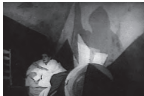
تصویر ۱ - سایه «سزار خوابگرد» بر دیوار اتاق آلن. ماخذ: (فیلم «کابینه دکتر کالیگاری»، ۱۹۲۰)

فیلمساز اکسپرسیونیست از طریق نورپردازی با کنتراست بالا، زوایای دوربینی خودنما و بازی‌های اغراق‌آمیز ظاهر واقعیت را درهم می‌شکست و واقعیتی جدید خلق می‌کرد که اعتقاد داشت حقیقت دنیای معاصرش است (رحیمیان، ۱۳۷۰، ۱۷). اصولاً یکی از مهم‌ترین و بارزترین خصوصیات فیلم‌های اکسپرسیونیستی، استفاده بیان‌گرایانه از سایه در جهت پیشبرد دراماتیک داستان است. شاید به جرأت بتوان گفت که صحنه کشته شدن «آلن» به دست «سزار» خوابگرد در فیلم کالیگاری نخستین استفاده بیان‌گرایانه از سایه در تاریخ سینما است (تصویر ۱).