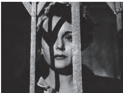
تصویر ۸ - سایه نرده آسانسور بر صورت برجیت اوشانسی. ماخذ: (بوردول، ۱۳۸۶، ۳۰۳)

فیلم نوآر آیینی است از اوضاع نابسامان و شرایط اقتصادی دوره جنگ جهانی دوم و ناپیدی پس از آن، و جامعه ای که بیش از پیش به پوچ بودگی و بی مفهومی ارزش های اجتماعی پی می برد. رابرت پرفریو حال و هوای نهفته در قلب فیلم نوآر را همان بدبینی می داند «که فیلم سیاه را برای ما سیاه می کند» و ادعا می کند که «این خصیصه ها از یک منبع در دسترس بسیار نزدیک یعنی مکتب داستانی سرایی (سرسخت ۴۱ )» برآمده است» (Conrad, 2006, 12). «گرایش فیلم نوآر، ریشه در رمان کارآگاهی سرد و غیر احساساتی آمریکایی دارد که در سال های ۱۹۲۰ شروع شد. داشیل همت در رمان هایش نسبت به داستان کارآگاهی سنتی بریتانیایی، واکنش نشان داد. دیگر نویسندگان مشهور داستان کارآگاهی خشن ریموند چندلر، جیمز ام. کین و کرنل ولریچ بودند که بسیاری از رمان های ایشان به فیلم برگردانده شده است؛ اما نخستین در این میان «شاهین مالت» اثر همت بود. از نظر پرداخت سینمایی، این فیلم از اکسپرسیونیسم آلمان، رئالیسم شاعرانه فرانسه و نوآوری های سیکی همشهری کین متأثر است.» (بوردول، ۱۳۸۶، ۳۰۲) «سام اسپید» (هامفری بوگارت) کارآگاه خصوصی است که باید تصمیم بگیرد آیا زن خیانت پیشه ای را که (شاید) او دوستش دارد تحویل پلیس بدهد یا نه. در انتها اسپید به تلخی زن را تحویل می دهد و پلیس «برجیت اوشانسی» (زن مد نظر) را به سوی آسانسور می برد و او با سایه - نرده درب آسانسور - ای که بر چهره اش افتاده به زن آرکتایپ فیلم نوآر بدل می شود (تصویر ۸).