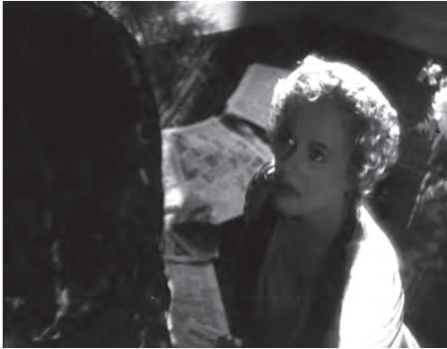
تصویر ۲۲ - سایه "کین" بر پیکر "سوزان الکساندر".

چیزی را به کسی ثابت کند چون در درجه‌اول استعداد لازم را ندارد. اما کین این مسئله را نمی‌پذیرد و سایه تیره‌ی جهل خود را بر پیکر ضعیف سوزان می‌اندازد.