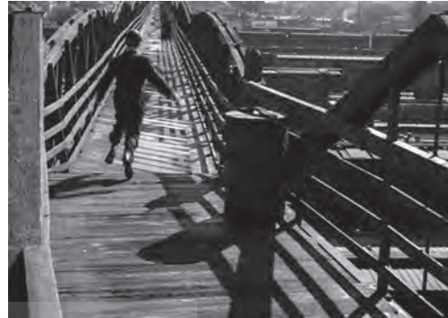
تصویر ۱۳- «فیلیپ ریون» فراری در احاطه سایه‌ها. ماخذ: (فیلم «آدمکشی مزدور»، ۱۹۴۲)

قهرمان داستان فیلم «آدمکشی مزدور» ۷۳ (فرانک تاتول، ۱۹۴۲) است. فضاهای تیره‌شهری و برون شهری همواره همانند آوار بر سر شخصیت اصلی داستان فرو ریخته‌اند. در اواخر فیلم، «فیلیپ ریون» (آلن لد) در حال فرار از پلیس به پلی می‌رسد که از دوسو از جانب پلیس مسدود شده است. سرگشتگی و سراسیمگی ریون در این فضا توسط سایه‌های مورب و تند نرده‌های پل به خوبی به تصویر کشیده می‌شود (تصویر ۱۳).