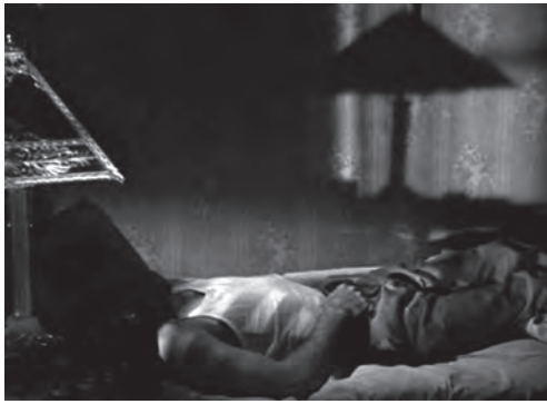
تصویر ۱۲ - قرار گرفتن چهره "سوئید اندرسن" در سایه. ماخذ: (فیلم "قاتلین"، ۱۹۴۶)

این امر کاملاً با شخصیت «سوئید» که مدت هاست در شهری کوچک از چشم دیگران پنهان شده، همگون است. همچنین چون این شخصیت در انتظار است تا افرادی او را یافته و به قتل برسانند - یعنی خود را برای مرگ مهیا کرده است - قرار گرفتن سر و صورتش در سایه، نشانی از رضایت وی از مرگ و تا حدودی آرامش به دست آمده ازین مرگ است. سیودوماک برای معرفی "کیتی کالینز" (اوا گادرنر) شخصیت اول زن داستان که از نمونه‌ای ترین زنان اغواگر فیلم نوآر است، نیز از شیوه‌ای مشابه بهره می‌برد. در اولین برخورد در نمایی نزدیک از وی، مخاطب چهره او را در حالی می‌بیند که سایه‌ای سمت چپ صورت وی را پوشانده و نیمی از صورت او در سایه فرو رفته است. و به این شیوه تاکید می‌کند که تنها بخشی از کاراکتر او بر بیننده آشکار و بخشی دیگر از وجود او تیره و پنهان در سایه است. این امر با شخصیت دورو و نیرنگ باز او که در نهایت "سوئید" را به نابودی می‌کشاند، کاملاً هماهنگ است. سیودوماک چهره سایر شخصیت‌های فیلم را نیز به شیوه‌ای مشابه با توجه به فضای داستان نورپردازی کرده است.