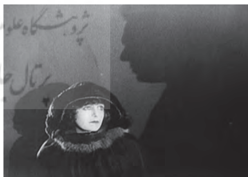
تصویر ۳ - سایه عظیم "دکتر مابوزه" و معشوقه‌اش "کارا کاروزا". ماخذ: (فیلم "دکتر مابوزه قمارباز"، ۱۹۲۲)

نوربرت ژاک ۳۳ بود. دو سال پس از اکران فیلم، خود لانگ این فیلم را سندی از دنیای معاصر خواند، و موفقیت بین‌المللی آن را به ویژگی مستندبودن آن نسبت داد. شخصیت دکتر مابوزه یک حاکم مستبد معاصر بود که عامل تحریک‌کننده‌اش، عطش برای رسیدن به قدرت نامحدود است. او رئیس یک باند جنایتکار است و با کمک آن جامعه را مورد ارباب قرار می‌دهد و ظهور او ثابت می‌کند که دیگر مستبدهای قدیمی یعنی نوسفراتو و کالیگاری نیز از اهمیتی معاصر برخوردار بوده‌اند. یکی از تاثیرگذارترین نماهای فیلم دکتر مابوزه، نخستین مواجهه مابوزه با معشوقه‌اش "کارا کاروزا" در فیلم است (تصویر ۳). در این تصویر، سایه عظیم مابوزه بر دیوار پشت سر کارا کاروزا افتاده است که هم حاکی از قدرت و احاطه بیش از حد مابوزه بر معشوقه‌اش است و هم نشانگر وجود تیره این شخصیت هزار چهره. لانگ در این نما با کاربرد هوشمندانه سایه هویت ذاتی شخصیت داستانش را به تصویر می‌کشد.