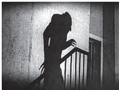
تصویر ۲ - سایه شوم "نوسفراتو". ماخذ: (فیلم "نوسفراتو: یک سمفونی وحشت"، ۱۹۲۲)

در دهه ۱۹۳۰ با ظهور حزب نازی در آلمان، سینمای اکسپرسیونیسم رو به زوال نهاد اما هم‌زمان با افول سینمای آلمان، در فرانسه و آمریکا به طور مجزا حرکات سینمایی در