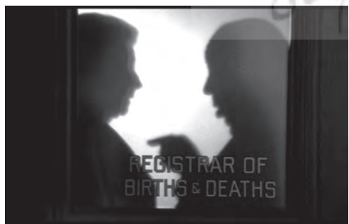
تصویر ۲۰- سایه هیچکاک در پشت شیشه. ماخذ: (فیلم "توطئه فامیلی"، ۱۹۷۶)

در این صحنه، سایه عملاً نشانی از شر و تیرگی درونی دو شخصیت منفی داستان است که آلیشا را تهدید می‌کنند. از آنجا که در هیچ کجای فیلم تاکیدی بر سایه وجود ندارد، استفاده از سایه‌ها در این صحنه بسیار تاثیرگذار است و دیدگاه و شرایط ذهنی شخصیت را به خوبی به مخاطب منتقل می‌کند. در فیلم «بیگانگان در قطار» ۸۰ (۱۹۵۱) نیز هیچکاک از سایه‌های شدید برای خلق فضاهای پرتنش و از نوارهای مورب و عمودی سایه برای پرداخت شخصیت‌ها و شرایط روحیشان، استفاده می‌کند. در صحنه‌ای که دو شخصیت اصلی داستان "گای" و "برونو" در قطار برای اولین بار یکدیگر را می‌بینند در حالی که نورپردازی صورت گای بسیار آرام و طبیعی است، صورت برونو با سایه‌هایی مورب ناشی از پرده‌های قطار، پیوسته قطع می‌شود که نشانی از ذات ملتهد و ناآرام اوست. پس از «بیگانگان» اغلب فیلم‌های هیچکاک رنگی هستند و وی بیشتر به کار با رنگ و نور و خلاقیت در شیوه روایت روی می‌آورد تا تصویرسازی‌های بصری با سایه. اما با این حال در آخرین فیلمش «توطئه فامیلی» ۸۱ (۱۹۷۶) و برای به رخ کشیدن استعدادش «سایه هیچکاک» را واقعاً در قالب سایه خودش در پشت در اتاقی در اداره ثبت تصویر می‌کند (تصویر ۲۰).