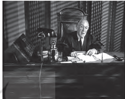
تصویر ۲۳ - سایه پردازی اغراق شده صحنه دادگاه. ماخذ: (فیلم "بانوئی از شانگهای"، ۱۹۴۷)

ولز از شیوه نورپردازی اغراق شده در بیشتر آثارش بهره برده است اما یکی از خاص‌ترین نمونه‌های آن مربوط به فیلم «محاکمه» (۱۹۶۲) است. او برای ایجاد فضایی موهومی و غیرواقعی از سایه بهره برده و چهره متولیان و ماموران قانون را از پایین و به شکل مورب نوردهی کرده است تا حالت رعب‌آوری به چهره آنها بدهد و بر قدرت آنها تاکید کند. در یکی