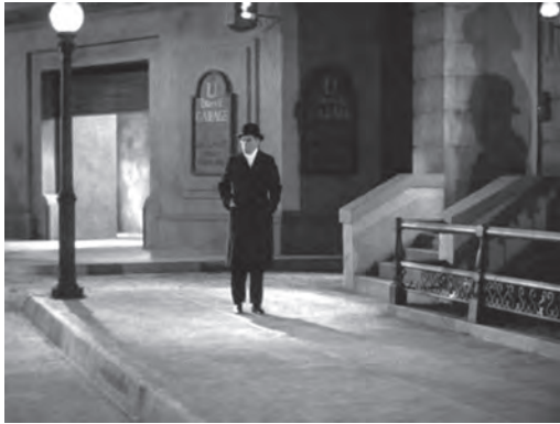
تصویر ۵- سایه دو گانگستر بر دیوار در سمت راست تصویر. ماخذ: (فیلم «دشمن مردم»، ۱۹۳۱)

گانگسترند اما در عین حال حاکی ازین هستند که این دو مرد با قدم گذاردن به جهان جنایت کاران بدل به سایه شده‌اند. نمونه‌ای‌ترین شیوه استفاده از سایه برای پرداخت شخصیت گانگستر و پیش برد روایی داستان را در «صورت زخمی» می‌توان دید. فیلم با سکانس-پلانی چهار دقیقه‌ای آغاز می‌شود که طی آن «لوئی کاستلو» رئیس فعلی گروهی از مافیای شهر پس از پایان میهمانی مجلی توسط ناشناسی که تنها سایه‌اش دیده می‌شود - و بعدتر مشخص می‌شود «تونی کامونتی» است - به قتل می‌رسد (تصویر ۶).