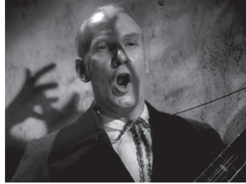
تصویر ۱۸- سایه دستها پشت سر نوازنده.

در این صحنه، سایه عملاً نشانی از شر و تیرگی درونی دو شخصیت منفی داستان است که آلیشا را تهدید می‌کنند. از آنجا که در هیچ کجای فیلم تاکیدی بر سایه وجود ندارد، استفاده از سایه‌ها در این صحنه بسیار تاثیرگذار است و دیدگاه و شرایط ذهنی شخصیت را به خوبی به مخاطب منتقل می‌کند. در فیلم «بیگانگان در قطار» ۸۰ (۱۹۵۱) نیز هیچکاک از سایه‌های شدید برای خلق فضاهای پرتنش و از نوارهای مورب و عمودی سایه برای پرداخت شخصیت‌ها و شرایط روحیشان، استفاده می‌کند. در صحنه‌ای که دو شخصیت اصلی داستان "گای" و "برونو" در قطار برای اولین بار یکدیگر را می‌بینند در حالی که نورپردازی صورت گای بسیار آرام و طبیعی است، صورت برونو با سایه‌هایی مورب ناشی از پرده‌های قطار، پیوسته قطع می‌شود که نشانی از ذات ملتهد و ناآرام اوست. پس از «بیگانگان» اغلب فیلم‌های هیچکاک رنگی هستند و وی بیشتر به کار با رنگ و نور و خلاقیت در شیوه روایت روی می‌آورد تا تصویرسازی‌های بصری با سایه. اما با این حال در آخرین فیلمش «توطئه فامیلی» ۸۱ (۱۹۷۶) و برای به رخ کشیدن استعدادش «سایه هیچکاک» را واقعاً در قالب سایه خودش در پشت در اتاقی در اداره ثبت تصویر می‌کند (تصویر ۲۰).