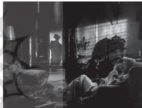
تصویر ۱۱ - سایه مورب پرده کرکره به همراه سایه "والتر نف" در مرکز قاب. ماخذ: (فیلم "گرامت مضاعف"، ۱۹۴۶)

«گرامت مضاعف» را می‌توان نمونه شاخص فیلم نوآر سال‌های جنگ جهانی دانست. قصه فیلم در جوی از سوء ظن و خیانت دو جانبه گام به گام پیش می‌رود و در قالب رشته‌ای از فلاش بک‌ها بازگفته می‌شود. فیلمنامه اثر بسیار قدرتمند است و در عین حال بسیاری از مشخصه‌های فیلم نوآر در فیلم حضور دارند. در این فیلم صحنه‌ها را نوری که از پشت کرکره‌ها یا دیگر اجزای دکور می‌تابد، روشن می‌کند. بسیاری از نمونه‌های فیلم نوآر از پرده‌های کرکره برای ایجاد تضاد صریح و نورپردازی سایه‌دار در صحنه داخلی بهره برده‌اند. خطوط مورب تیره حاصل از این کار سبب ایجاد ناهمگونی و افزایش تنش فضای فیلم می‌شود. این شیوه که در فیلم‌های گانگستری نیز به کار برده می‌شد، در فیلم نوآر به اوج خود رسید و بدل به یکی از کدهای بصری و قرارداد سبکی این گونه سینمایی شد و به عنوان نمادی از تنش و عدم ثبات در اغلب فیلم‌های نوآر حضوری پر رنگ دارد. اما نمونه‌ای‌ترین کاربرد این شیوه متعلق به فیلم «گرامت مضاعف» است (تصویر ۱۱).