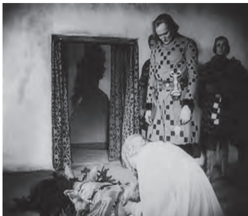
تصویر ۴ - سایه "هاگن" در مرکز قاب. ماخذ: (فیلم "زیگفید"، ۱۹۲۴)

می‌کند (تصویر ۲)، سایه این شخصیت که تیپ بسیار آشنایی از رهبران نازی را پیشگویی می‌کند، هم متراکم بودن اساطیری دنیای نیبلونگن را تقویت می‌کند و هم بر محتوم بودن سرنوشت این شخصیت تاکید می‌نماید.