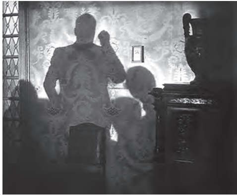
تصویر ۱۵ - سایه‌سرا ن گروه های تبهکار.