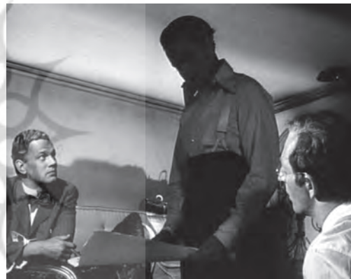
تصویر ۲۱ - چهره کین در سایه. ماخذ: (فیلم "همشهری کین"، ۱۹۴۱)

در فیلم، دو بار چهره "کین" در سایه قرار می‌گیرد در حالی که اطراف او به خوبی نوردهی شده است. نخستین بار زمانی است که در جوانی "اعلامیه اصول زندگی" را نوشته و می‌خواهد آن را در روزنامه‌اش چاپ کند (تصویر ۲۱).