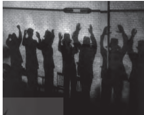
تصویر ۷ - به گلوله بستن افراد گروه «گفنی».

لحظه در قدرت باشد ولی سرنوشتی چون سرنوشت لویی در انتظارش است. میحشی که پیش‌تر در مورد «هیچ بودگی» سایه در ادبیات مورد اشاره قرار گرفت نیز در فیلم گانگستری و به ویژه در صورت زخمی نمودی بصری می‌یابد. در صحنه‌ای که گانگسترهای گروه «گفنی» در کنار دیوار ردیف شده و توسط افراد تونی به گلوله بسته می‌شوند، این «هیچ بودگی» به اوج خود می‌رسد (تصویر ۷).