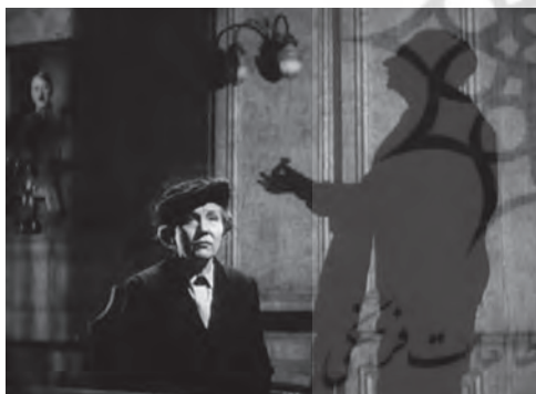
تصویر ۱۶ - سایه افسر ارشد اس.اس در حال بازجویی. ماخذ: (فیلم "جلادهان نیز می‌میرند"، ۱۹۴۳)

در «جلادهان نیز می‌میرند» ۷۸ (۱۹۴۳)، لانگ از سایه به شیوه‌های گوناگون برای بیان حالات و مفاهیم بهره برد. هنگامی که یکی از افسران اس.اس. از مادر خانواده بازجویی می‌کند لانگ تنها سایه‌ی وی را در سمت راست کادر و ایستاده نشان می‌دهد و به این شیوه، فرد صاحب قدرت را به وسیله سایه به نمایش می‌گذارد (تصویر ۱۶).