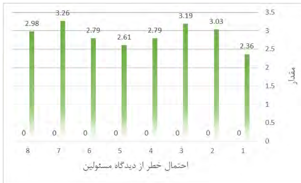
شکل ۳: احتمال خطرات تاثیرگذار بر توسعه توریسم شهرستان مشکین شهر از دیدگاه مسئولین (منبع، نگارندگان، ۱۴۰۱)