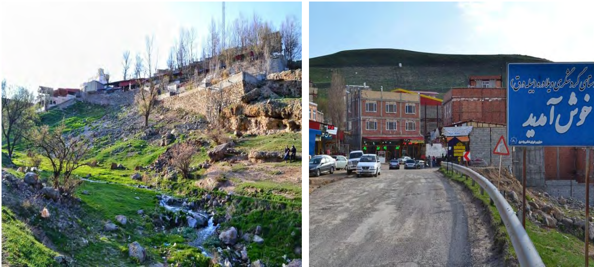
شکل ۲: نمایی از منطقه ژنوتوریستی ویلادرق

کنزق: از آنجایی که سرعین شهری باستانی و بسیار کهن است، دیدنی‌های تاریخی زیادی در خود جای داده است. یکی از این دیدنی‌ها، غارهای باستانی کنزق است. این غارها در روستایی به نام کنزق قرار دارند. این محوطه باستانی شامل قبرستان تاریخی، تپه و دخمه‌های صخره‌ای به هم پیوسته‌ای است که شواهد سطحی اراضی محوطه نشانگر استقرار قبل از اسلام می‌باشد در دوره‌های اسلامی روی محوطه قدیمی خانه چینه‌ای و خشتی دوره متأثر ساخته و به‌عنوان محل زندگی استفاده می‌شد که طی زلزله سال ۱۳۷۵ تخریب و هم اکنون این محوطه متروک و دخمه‌ها نیز در زیر انبوهی از آوار ناپدید شده است (شکل ۳).