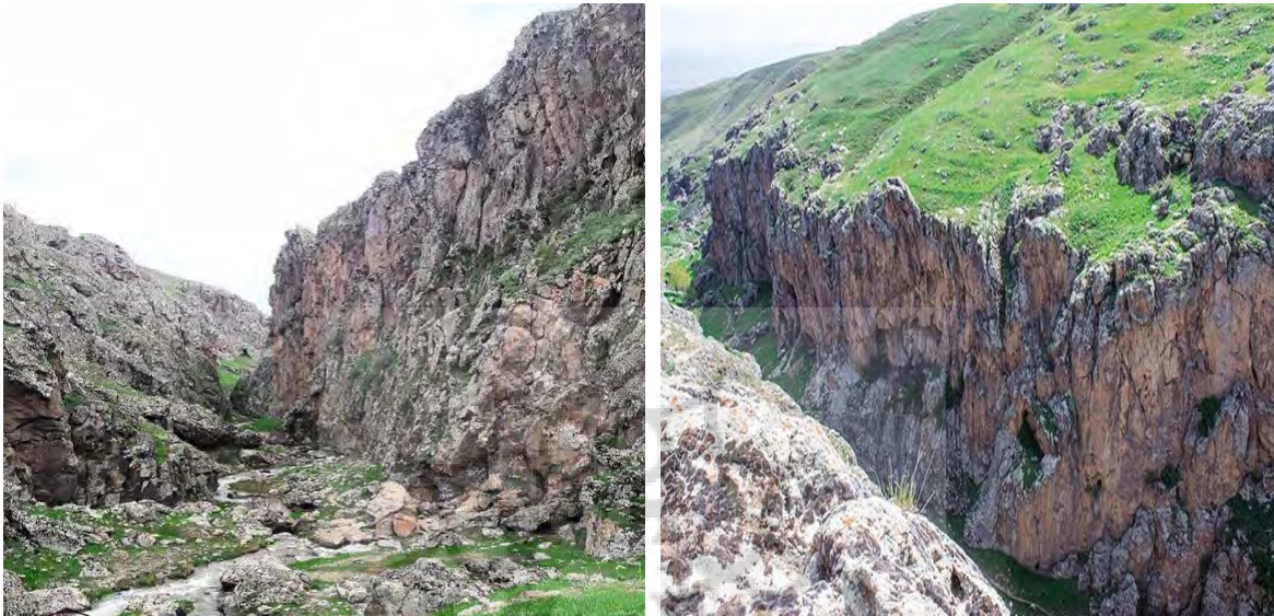
شکل ۴: نمایی از منطقه بکر ژئوتوریستی در بند ورگه سران دامنه کوهستان سبلان

در بند ورگه سران: شهرستان سرعین به سبب داشتن طبیعتی جذاب و منحصر به فرد یکی از غنی‌ترین استان‌های ایران در زمینه داشتن جاذبه‌های طبیعی گردشگری است. یکی از این جاذبه‌های طبیعی کم‌تر شناخته شده آبشار زیبای ورگه سران است. این روستا که در دهستان آب‌گرم شهرستان سرعین و در بخش مرکزی آن قرار گرفته است. حدود ده کیلومتری با شهر سرعین فاصله دارد شکل (۴).