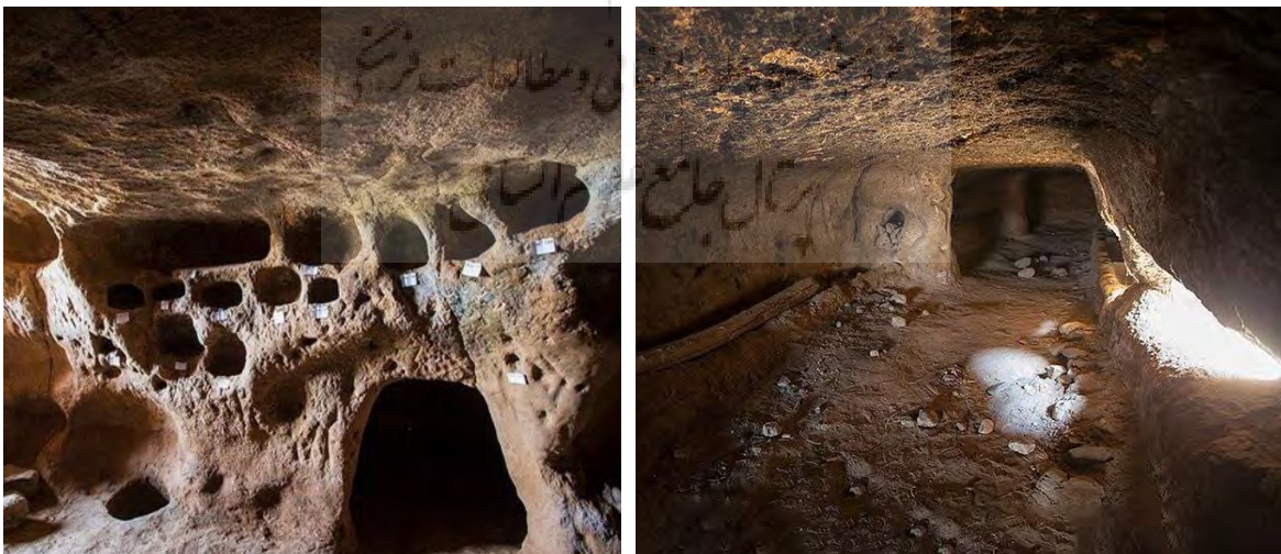
شکل ۳: نمایی از غارهای ژنوتوریستی روستایی گردشگری کنزق

کنزق: از آنجایی که سرعین شهری باستانی و بسیار کهن است، دیدنی‌های تاریخی زیادی در خود جای داده است. یکی از این دیدنی‌ها، غارهای باستانی کنزق است. این غارها در روستایی به نام کنزق قرار دارند. این محوطه باستانی شامل قبرستان تاریخی، تپه و دخمه‌های صخره‌ای به هم پیوسته‌ای است که شواهد سطحی اراضی محوطه نشانگر استقرار قبل از اسلام می‌باشد در دوره‌های اسلامی روی محوطه قدیمی خانه چینه‌ای و خشتی دوره متأثر ساخته و به‌عنوان محل زندگی استفاده می‌شد که طی زلزله سال ۱۳۷۵ تخریب و هم اکنون این محوطه متروک و دخمه‌ها نیز در زیر انبوهی از آوار ناپدید شده است (شکل ۳).