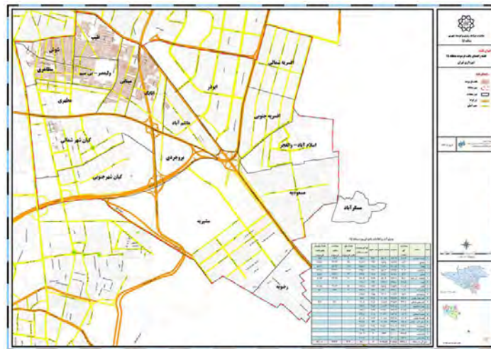
شکل (۲): محدوده بافت فرسوده منطقه مورد مطالعه