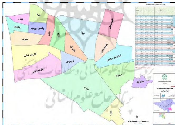
شکل (۱): محدوده منطقه مورد مطالعه

منطقه ۱۵ شهرداری تهران یکی از مناطق شهری تهران است که در جنوب شرقی شهر تهران قرار دارد. مهم ترین بخش آن شهرک های مشیریه و افسریه و بروجردی و سیزده آبان و بزرگراه های بسیج و بعثت و امام علی و آزادگان و خاوران است. شهرداری این منطقه در ضلع غربی پایانه اتوبوسرانی خاوران واقع گردیده است. جمعیت این منطقه براساس سرشماری سال ۱۳۹۰ ایران، ۶۳۸،۷۴۰ نفر (۱۹۲،۶۱۰ خانوار) شامل ۳۲۵،۳۱۳ مرد و ۳۱۳،۴۲۷ زن می باشد. با توجه به پر بودن بافت های شهری شکل گیری کانون مسکونی و عملکردی شبکه معابر و درجه بندی عملکردی آنها و سایر ویژگی های منطقه بکارگیری یک روش واحد محله بندی و تقسیم کالبدی منطقه به محله های دارای مرکزیت مکانی توجیه پذیر نیست.