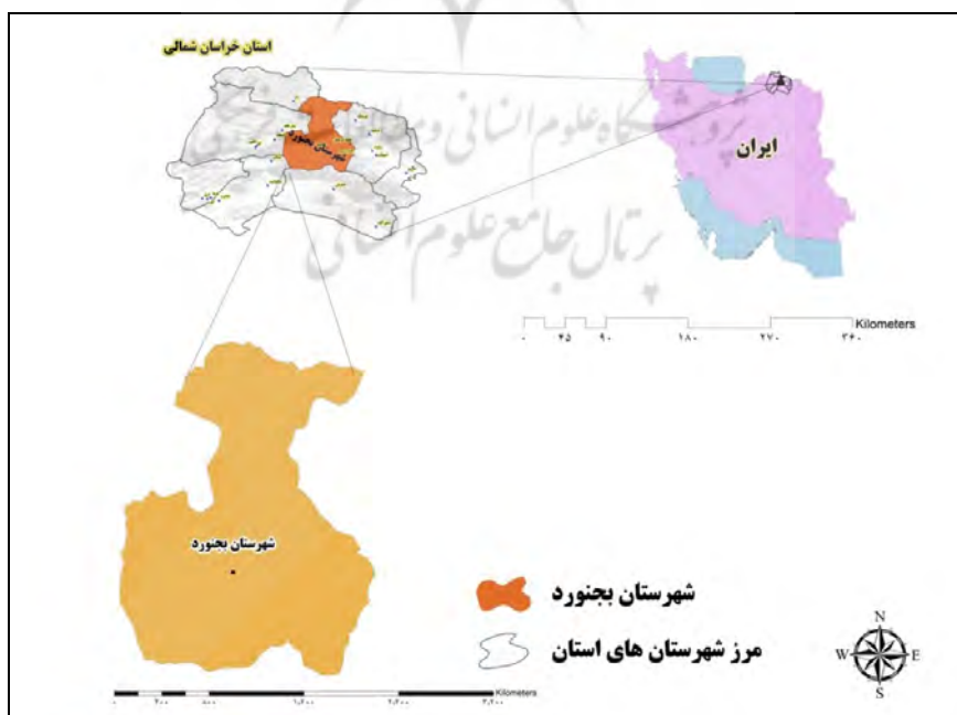
شکل ۱. موقعیت جغرافیایی محدوده مورد مطالعه

از لحاظ موقعیت جغرافیایی شهرستان بجنورد در گستره شمال شرقی ایران بین ۵۷ درجه و ۱۷ دقیقه تا ۵۷ درجه و ۲۸ دقیقه طول شرقی و ۳۷ درجه و ۱۳ دقیقه تا ۳۷ درجه و ۵۰ دقیقه عرض شمالی واقع شده است. شهرستان بجنورد به مرکزیت شهر بجنورد، بخش‌های مرکزی و شمالی استان خراسان شمالی را به خود اختصاص داده و از شمال با کشور ترکمنستان، از شرق به شهرستان شیروان، از غرب به شهرستان مانه و سملقان و از جنوب به شهرستان‌های اسفراین و جاجرم محدود می‌شود. این شهرستان با مساحت حدود ۶۵۶۳ کیلومتر مربع ۲ شهر، ۲ بخش، ۸ دهستان و ۱۵۳ آبادی دارد. این شهرستان در حال حاضر دارای ۲ بخش (مرکزی و گرمخان) و ۵ دهستان (گرمخان، گیفان، بدرانلو، بابا امان، آلاداغ) است و برابر آخرین سرشماری عمومی نفوس و مسکن سال ۱۳۹۵ دارای ۳۲۴۰۸۳ نفر جمعیت است.