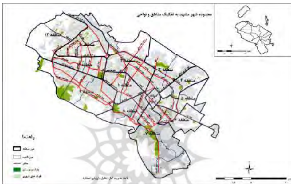
شکل ۲. محدوده شهر مشهد به تفکیک مناطق و نواحی مأخذ: (شهرداری مشهد، ۱۳۹۷، ص. ۳۰).

بر مبنای سرشماری سال ۱۳۹۵، جمعیت شهر مشهد برابر با ۳۰۵۷۶۷۹ نفر بوده است. بر این جمعیت بایستی جمعیت حدود ۲۰ میلیون نفر زائر داخلی و ۱۷۷۶۳۳۷ زائر و گردشگر خارجی را نیز اضافه نمود (شهرداری مشهد، ۱۳۹۷، ص. ۶۳). چنین حجم جمعیتی، بار بسیار زیادی بر محیط زیست وارد می کند، و مدیریت منابع و مصارف را با حساسیت بالایی مواجه می سازد.