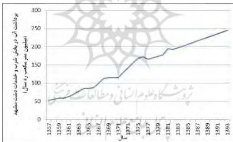
شکل ۳. مقایسه برداشت آب در بخش شرب و خدمات در دشت مشهد

یکی از مهمترین مشکلات ایجاد شده برای این حجم از جمعیت، مشکل کمبود آب است. در واقع با وجود کمبود شدید منابع آبی در این دشت نسبت به سایر نقاط استان، بیش از ۵۰ درصد جمعیت استان در این محدوده واقع گردیده است. فرآیند افزایش جمعیت در دشت مشهد به عنوان یک نیروی محرک موثر بر مصرف منابع آب همواره فعال بوده است. ادامه این روند طی دوره ۶۰ ساله گذشته منجر به افزایش جمعیت منطقه شده که به نوبه خود تخصیص بیشتر منابع را در بخش شرب و خدمات در پی داشته است. افزایش جمعیت منجر به افزایش ثانویه فعالیت‌های اقتصادی و در نهایت افزایش تقاضا برای این منبع محدود شده است. (دانشگاه فردوسی مشهد، ۱۳۹۶، ص. ۳۰). چنانچه از شکل ۳ پیداست سرانه مصرف روزانه در سالهای مورد نظر از یک روند کاهشی برخوردار بوده است.