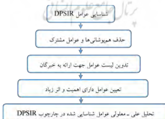
شکل ۱. مراحل انجام پژوهش