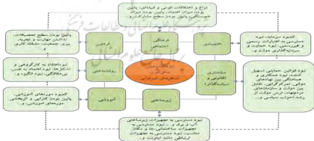
شکل ۱: مدل مفهومی پژوهش - (منبع: براساس واکاوی ادبیات و پیشینه موضوع، ۱۳۹۹)