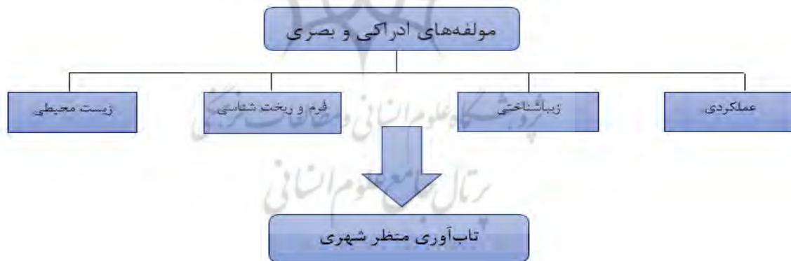
شکل (۱) مدل مفهومی پژوهش

در انتخاب شاخص‌های تحقیق سعی شده است که مهم‌ترین آن‌ها در ارتباط با موضوع تاب‌آوری منظر، انتخاب شوند. متغیرهای مستقل این تحقیق شاخص‌های عملکردی،