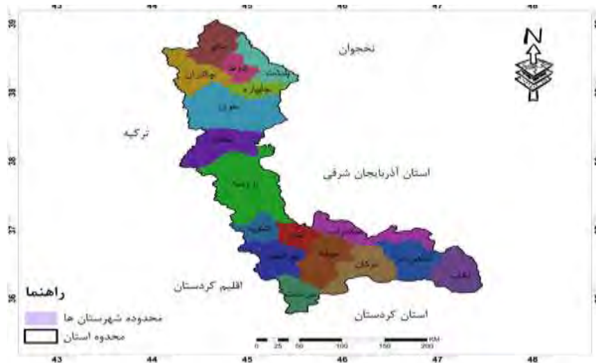
شکل ۱: منطقه مورد مطالعه