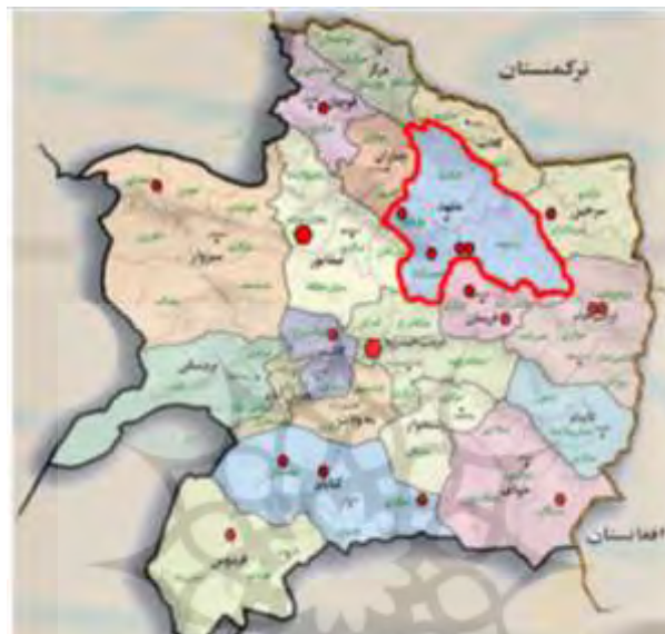
شکل ۱. پراکندگی برخی از معادن عمده گهرسنگ در شهر جهانی گهرسنگ‌ها و اطراف آن

ص. ۵۹۳). علاوه بر این، وضعیت مناسب جغرافیایی و معدنی منطقه باعث شده است که نزدیک به ۴۰ درصد از سنگ‌های قیمتی و نیمه‌قیمتی کشور در خراسان و اطرافش قرار بگیرد (اسدی مرصع، ۱۳۹۷، ص. ۵۴).