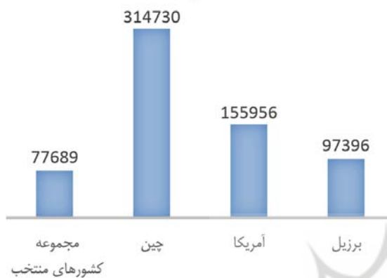
نمودار ۱: میانگین تولید انرژی‌های تجدیدپذیر به مگاوات (۲۰۰۷-۲۰۱۸)

نداشته‌اند. به نحوی که میانگین جمع انرژی‌های تجدیدپذیر تولید شده در ۴۰ کشور منتخب اسلامی ۷ (نمونه آماری این تحقیق) با بیش از ۱/۵ میلیارد نفر جمعیت در طی سال‌های ۲۰۰۷-۲۰۱۸ حتی از تولید انرژی‌های تجدیدپذیر کشور برزیل با جمعیت ۲۱۰ میلیون نفر نیز کمتر است (نمودار ۱).