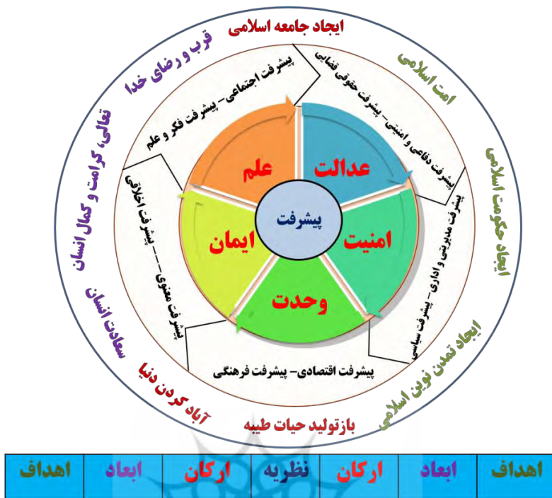
شکل ۷: نظریه اسلامی پیشرفت براساس بیانات و مکتوبات رهبری