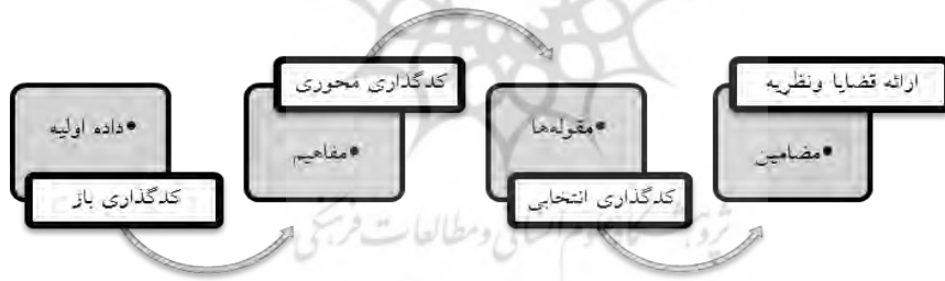
شکل ۳: مراحل کُدگذاری در روش نظریه داده‌بنیاد

گام ششم: کُدگذاری انتخابی که در واقع نتیجه کار خواهد بود و نظریه، در موضوع مورد نظر، آماده برای رُخ نمایاندن است. به بیان دیگر کدهای محوری، باتوجه‌به جنس آنها، در قالب کد انتخابی، انتخاب می‌گردند.