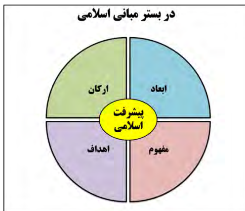
شکل ۱: الگوی مفهومی پژوهش