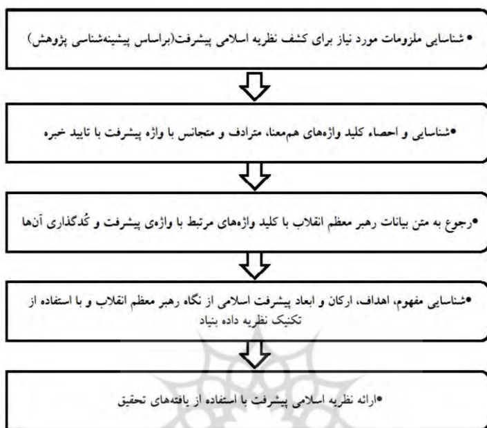
شکل ۲: فرآیند روش پژوهش