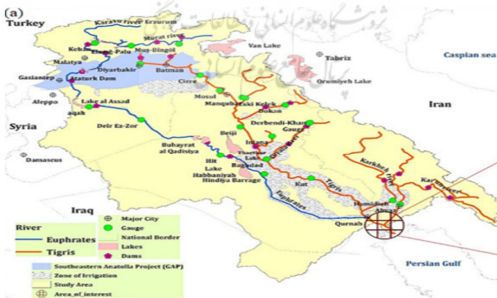
شکل ۱- مسیر رودخانه‌های دجله و فرات

خاک ترکیه و هم در کشورهای همسایه از جمله ایران در پی داشته که بروز پدیده ریزگردها از جمله پیامدهای زیست‌محیطی انکارناپذیر این طرح‌هاست. در گزارش حاضر تلاش شده است تا آسیب‌شناسی در خصوص دیپلماسی آب کشور با تأکید بر حوضه دجله و فرات صورت گیرد. از این رو نخست، رودخانه‌های دجله و فرات به‌عنوان دو رودخانه مرزی ایران و ترکیه معرفی شده و سپس دیپلماسی کشورهای ترکیه، عراق و ایران در خصوص مدیریت آب‌های مرزی و نیز چالش‌های موجود در تعاملات هیدروپلیتیکی دو کشور ایران و ترکیه مورد بررسی قرار گرفته است. در نهایت، در قالب به‌کارگیری دیپلماسی کارآمد در رابطه با مدیریت آب‌های فرامرزی، ملاحظات و راهکارهایی به تصمیم‌گیران برای مدیریت یکپارچه و مؤثرتر منابع آبی کشور و کاستن از پیامدهای بحران کمبود آب و تقویت زمینه‌های دیپلماسی زیست‌محیطی پیشنهاد شده است.