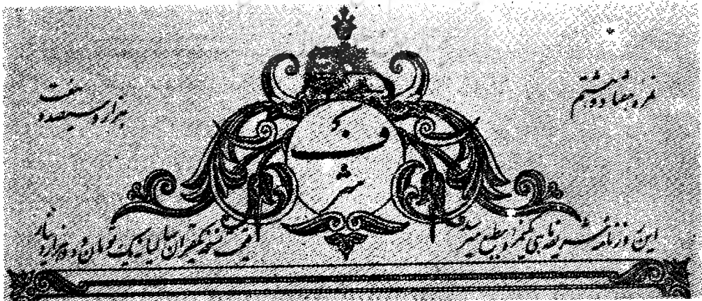
عکس شماره ۱۳

«برسم صور عاظم این مملکت و اگر مقتضی شد شبیه اعیان ممالک دیگر از اروپا و آسیا و آمریکا بلکه افریقائی و استرالی هم ترسیم یابد و در ذیل هر صورت شرح حال صاحب صورت مرقوم شود.» (عکس شماره ۱۳)