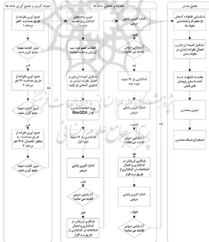
شکل ۱: فرایند تحلیل محتوا و کنترل کیفیت پژوهش مطابق با مدل (Schou et al., 2012)

اعتبارپذیری: هدف، روش پژوهش، جمع آوری و ثبت داده ها روشن شده است. کدبندی ها (تحلیل داده ها) با نظارت کمیته ارزیاب و با استفاده از نظرات یک تیم دو نفره ارزیابی انجام و از واقعی بودن توصیف ها و یافته های پژوهش اطمینان حاصل شده است. ضمناً چهارچوب مصاحبه برپایه نتایج سایر پژوهش های مشابه طراحی شده است. انتقال پذیری: شیوه انتخاب اطلاعات و جامعه و اعضای نمونه تشریح شده است؛ شیوه کدبندی های صورت گرفته و همچنین چگونگی استخراج آن ها تشریح شده است؛ زمینه پژوهش شامل زمان و مکان و ... مشخص است؛ رابطه بین پژوهشگر و زمینه پژوهش مشخص است. تعداد نمونه ها در این پژوهش به توصیه عمومی حدود ۲۰ مورد در نمونه گیری های نظری را رعایت کرده است و لذا توصیف غنی از نظرات جمع آوری شده است. ضمناً با توجه به آنکه اعضای نمونه از لایه های مختلف صنعت بیمه شامل بیمه مرکزی، شرکت های بیمه، شبکه فروش و شرکت های تأمین کننده در مصاحبه ها حضور داشته اند، نتایج این پژوهش جهت استفاده در برنامه ریزی ها از نگاه لایه های مختلف