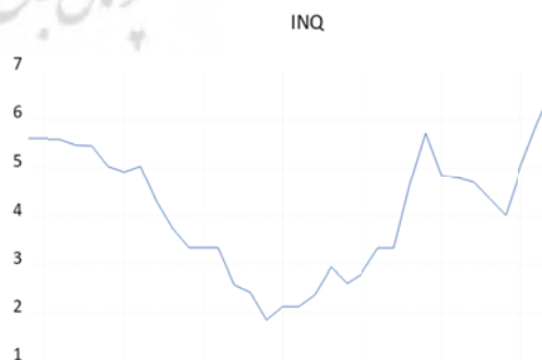
نمودار ۱. روند شاخص کیفیت نهادی

در نمودار (۲) روند شاخص توسعه مالی در دوره مورد بررسی ارائه شده است: