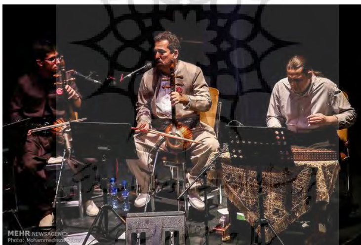
تصویر ۲. اجرا کامکارها با لباس کردی در عمارت مسعودیه تهران

علاوه بر اجراهای جهانی، در اجراهای ملی نیز در بسیاری از موارد، کامکارها از پوشش کردی در اجرای کنسرت‌هایشان استفاده می‌کنند و معمولاً هم این انتخاب کامکارها در شیوه پوشیدن لباس، با استقبال زیاد مخاطبان همراه است. درک اولویت‌های مخاطبان برای گنجاندن محصولات فرهنگی، در بازارهای فرهنگی تعیین‌کننده است و پایداری تقاضا را تضمین می‌کند (Guerrero Melo, 2013). از این رو اجرای موسیقی با لباس محلی می‌تواند یک راه خلاقانه برای تضمین حضور مخاطب در اجراها باشد؛ به‌ویژه اینکه مخاطبان در عصر همسانی پوشش‌ها، اکنون به دنبال شیوه‌های متمایز لباس پوشیدن هستند. این شیوه‌های جدید در انتخاب پوشش، بیشتر می‌توانند نظر مخاطب ملی و جهانی را جلب کنند؛ زیرا آن‌ها در معرض نوع جدیدی از سبک زندگی قرار می‌گیرند که با روال معمول زندگی روزمره متفاوت است. یک نمونه در این زمینه، اجرای کامکارها در عمارت مسعودیه است که در ادامه، تصویری از برادران کامکار که با لباس کردی در حال نواختن ساز هستند، ارائه می‌شود: