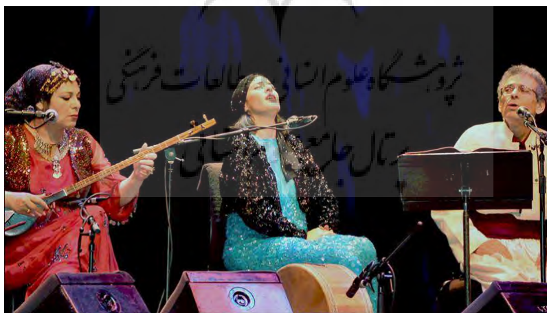
تصویر ۱. اجرای کامکارها با لباس کردی در کنسرت لندن

در پوشش محلی کامکارها در بسیاری از کنسرت‌هایشان به‌ویژه در مراسم‌هایی که قصد دارند آهنگ‌های محلی کردی را اجرا کنند، از لباس‌های محلی کردی استفاده می‌کنند. مردان و زنان گروه با لباس‌های محلی روی صحنه می‌روند و این یکی از اولین مؤلفه‌هایی است که سبب جذب مخاطب از همان لحظات آغازین اجرا شود. این مسئله به‌ویژه در اجراهایی که کامکارها در سطح جهانی داشته‌اند، بیشتر نمود پیدا کرده است؛ زیرا در این اجراهای فراملی، کامکارها به‌عنوان نماینده کشور ایران حضور دارند و با پوششی که انتخاب می‌کنند، فرهنگ و هویت یکی از اقوام ایرانی را تبلیغ می‌کنند. یکی از نمونه‌های شاخص در این زمینه، استفاده از لباس و پوشش کردی در کنسرت سال ۲۰۰۳ در اسلو، پایتخت کشور نروژ بود که کامکارها به مناسبت اعطای جایزه صلح نوبل به شیرین عبادی، روی صحنه رفتند. نمونه دیگر استفاده کامکارها از پوشش کردی، کنسرت لندن است که تصویری از آن در ادامه ارائه می‌شود: