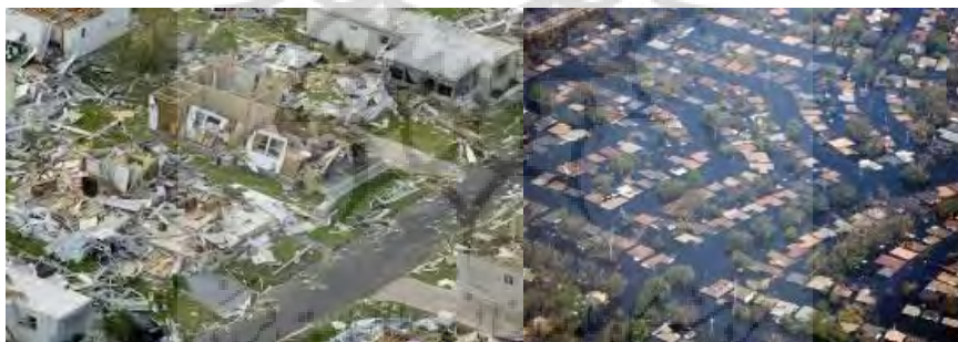
تصویر ۲. مناطق آسیب‌دیده از طوفان کاترینا (۲۰۰۵) ۴

«طوفان کاترینا یکی از فاجعه‌بارترین بلایای طبیعی در ایالات متحده آمریکا بوده است. این طوفان که در سال ۲۰۰۵ میلادی رخ داد، بخشی از کرانه‌های آمریکایی خلیج مکزیک از نیواورلئان در ایالت لوئیزیانا تا موبیل در ایالت آلاباما را درنوردید و به ویرانی کشید و به مدت ده روز ادامه داشت. سرعت این طوفان که ۲۸۰ کیلومتر بر ساعت بود، ۸۰ درصد شهر نیواورلئان ۲ را غرق کرد و موجب مرگ ۱۸۳۶ تن و آوارگی یک میلیون نفر شد. خسارت مالی ناشی از کاترینا نیز ۱۲۵ میلیارد دلار برآورد شده که سبب شد این حادثه به یکی از مخرب‌ترین، مرگبارترین و گران‌ترین بلایای طبیعی در تاریخ ایالات متحده تبدیل شود. چنین فاجعه انسانی از زمان جنگ داخلی آمریکا، در ایالات متحده دیده نشده بود. جاری‌شدن سیل که عمدتاً در نتیجه نقص مهندسی در سیستم حفاظت و کنترل سیل بود و در اطراف شهر نیواورلئان ایجاد شده بود، بیشترین تلفات جانی را به بار آورد.» ۳ تصویر ۲ برخی از ویرانی‌های ناشی از طوفان کاترینا را نشان می‌دهد: