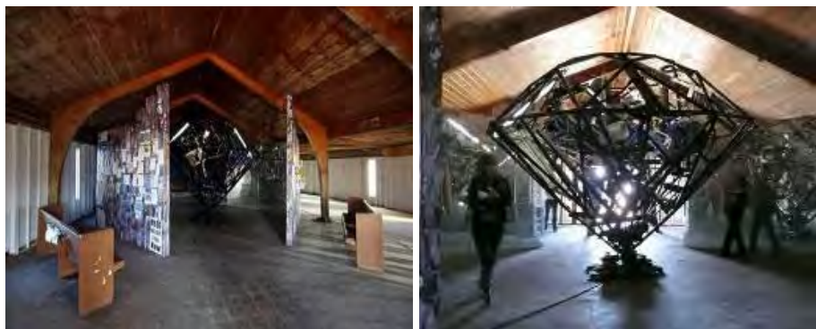
تصویر ۵. پروژه باشگاه الماس اثر ناروی وارد (۲۰۰۸) ۱

«المان مرکزی به شکل الماس که اندازه آن تقریباً یازده در شش فوت بود، روی زمین نصب و با دیوارهای مستقل آینه‌ای احاطه شده بود و بازدیدکننده از دو جهت وارد محل نصب سازه الماس شکل می‌شد. نمای بیرونی دیوار نیز همچنین به‌عنوان تابلوی اعلانات جامعه استفاده می‌شد که مردم می‌توانستند نظرات خود را روی آن ارائه دهند. علاوه‌براین، در تمام مدت، یک پس‌زمینه موسیقی متن فضای کلیسا را پر می‌کرد. او از صدای رهبران سیاه‌پوست آفریقایی-آمریکایی مانند مارتین لوتر کینگ، مالکوم ایکس و مارکوس گاروی استفاده کرد تا بتواند یک روحیه نشاط‌آور و مانوس برای جامعه محلی ایجاد کند. در پس‌زمینه موسیقی متن، یک ترانه بودایی با صدای «تینا ترنر» (هنرمند سیاه‌پوست) نیز ترکیب شده بود. منظور از ترکیب شعارهای معنوی، ایجاد یک روحیه انگیزشی برای محیط و بازگرداندن حس معنویت قبلی به فضای کلیسا بود» (Topal, 2016: 15).