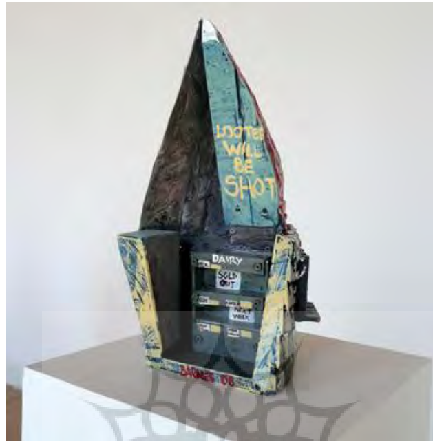
تصویر ۷. اثر جان بارنز، هنرمند نیوآورلئانی (۲۰۰۸) ۱