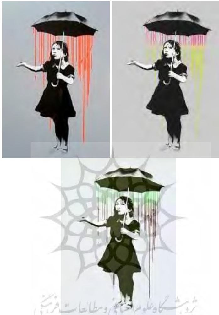
تصویر ۹. نمونه‌هایی چاپ‌شده از نولا، با باران‌هایی به رنگ سبز، نارنجی و چندرنگ ۱