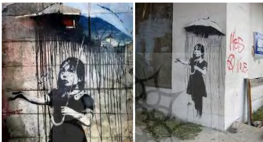
تصویر ۸. نولا (دختر چتر به دست) اثر بنکسی، نیواورلئان (۲۰۰۸) ۲

برای فاجعه طوفان کاترینا و بخش مهمی از تاریخ هنر خیابانی برشمرده می‌شود. این نقاشی یکی از تأثیرگذارترین و زیباترین آثار بنکسی در نیواورلئان و تنها نمونه باقی‌مانده از مجموعه‌ای است که پس از طوفان کاترینا خلق شد. بقیه یا تخریب شده‌اند یا به سرقت رفته‌اند یا در موزه‌ها و گالری‌ها نگهداری می‌شوند. ۱