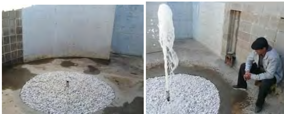
تصویر ۴. فواره اثر رابین رود (۲۰۰۸). ۱