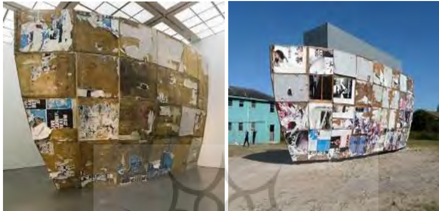
تصویر ۳. کشتی میترا اثر مارک بردفورد (۲۰۰۸) ۱

ایجاد روحیه امید و سازندگی در مردم شهر بود. این اثر در حال حاضر در دانشگاه ایالتی اوهایو نگهداری می‌شود.