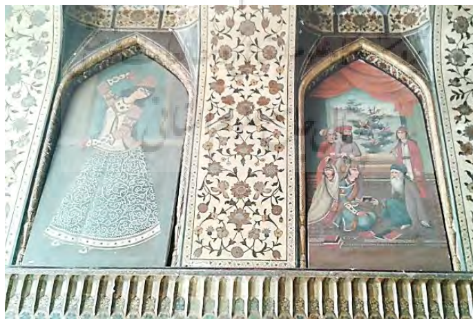
تصویر ۶. عمارت کلاه‌فرنگی، موزه پارس شیراز

کاخ ملت در مجموعه سعدآباد تهران: در قسمت زیر سقف سرسرای دوم کاخ ملت، چهار نقاشی روی کرباس وجود دارد که بر سطح دیوار چسبانده و در واقع تبدیل به دیوارنگاره بوم‌پارچه شده است. موضوع این نقاشی‌ها برگرفته از شاهنامه فردوسی است که حسین طاهرزاده بهزاد آن‌ها را به سبک قهوه‌خانه‌ای و با تکنیک رنگ و روغن اجرا کرده است. اندازه طول نقاشی‌ها حدود شش متر است (تصویر ۷). همچنین در تالار پذیرایی بزرگ کاخ ملت، دیوارنگاره بوم‌پارچه‌ای وجود دارد که هم موضوع نقاشی اروپایی و هم شیوه اجرای اثر مانند دیوارنگاره‌های بوم‌پارچه اروپایی است. اطراف نقاشی یک کادر گچی اجرا شده که شبیه به قاب، اثر را دربرگرفته است (جدول ۳).