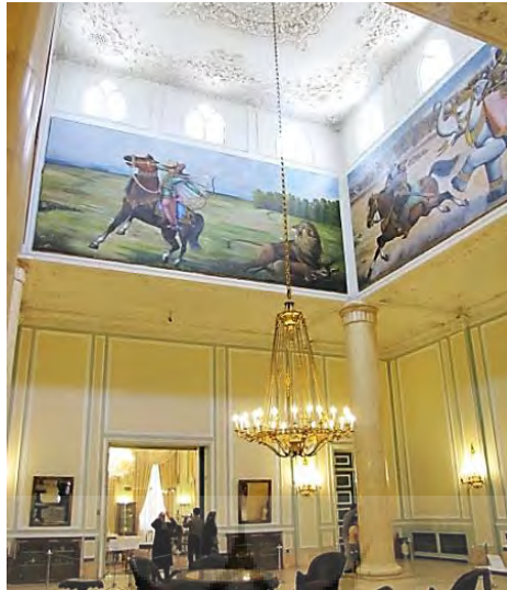
تصویر ۷. دیوارنگاره‌های بوم‌پارچه در سرسرای دوم کاخ ملت (منبع: نگارنده)