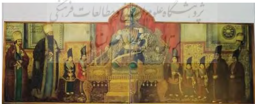
تصویر ۱. دیوارنگاره بوم‌پارچه کاخ نظامیه، ناصرالدین‌شاه بر تخت خورشید، ۲۴۰×۵۵۰ سانتی‌متر

پس از خراب‌کردن عمارت نظامیه، پرده‌های مزبور برای موزه ایران باستان خریداری شد و اینک دورتادور تالار خزانه نصب شده است (ذکاء، ۱۳۴۲ ب: ۲۰). کاخ نظامیه تهران در دهه‌های قبل تخریب شده که دیوارنگاره‌های بوم‌پارچه آن در حال حاضر در کاخ گلستان تهران به‌عنوان نقاشی روی کرباس نگهداری می‌شود (شکل ۱).