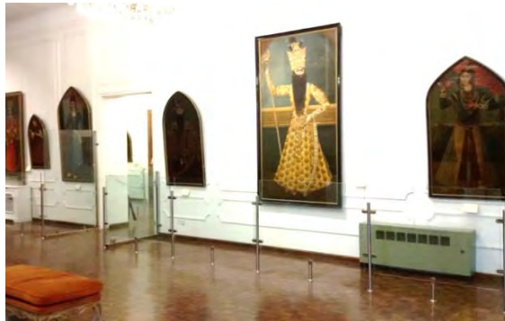
تصویر ۴. تعدادی از نقاشی‌های موزه هنرهای معاصر مجموعه سعدآباد تهران که در گذشته دیوارنگاره بوم‌پارچه بوده‌اند