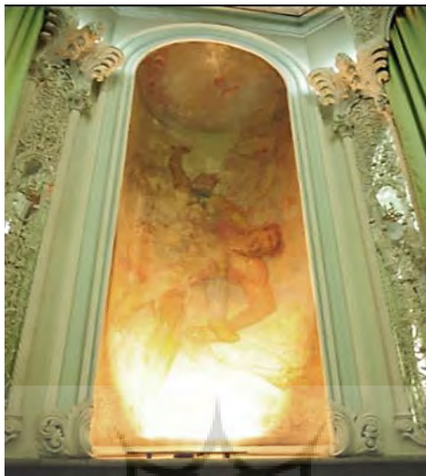
تصویر ۸. یکی از دیوارنگاره‌های بوم‌پارچه‌ی زورخانه‌ی بانک ملی تهران