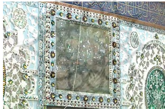
تصویر ۵. دیوارنگاره بوم‌پارچه ضلع شمالی گنبدخانه امامزاده حسین قزوین (منبع: نگارنده)