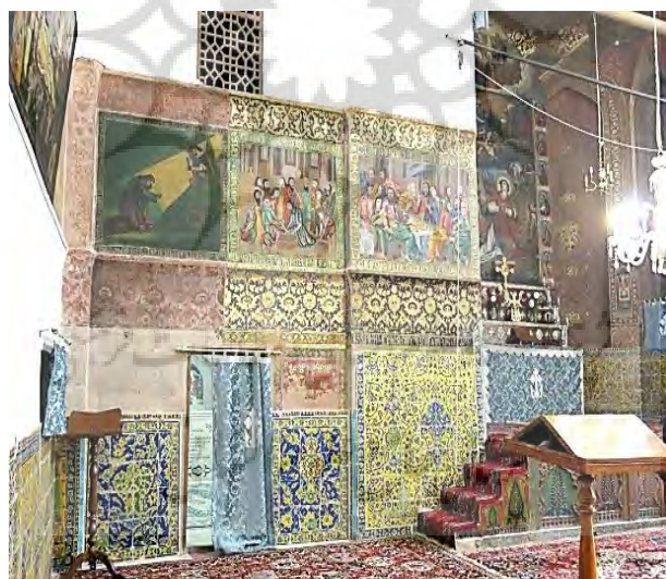
تصویر ۹. دیوارنگاره‌ی بوم‌پارچه‌ی کلیسای استپانوس اصفهان

کلیسای استپانوس مقدس: این کلیسا در سال ۱۶۱۴ م. در جلفای اصفهان ساخته شده است. دیوارهای داخلی با گچ پوشانده شده‌اند و نقاشی‌های دیواری بسیار کمی دارند (هوسپیان،