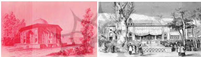
تصویر شماره ۵: تصویر سمت راست: باغ ترسیم شده توسط فلاندن، تصویر سمت چپ: تصویر قصر قجر ، ماخذ: (فلاندن، ۱۳۵۶).

راستش، باغ‌های متعددی است که درختان بلند قامت دارند. در یک فرسخی تهران قصری جهت تابستانش برپا نموده است که نامش "قصر قجر" یا "تخت قجر" می‌باشد، سطح این قصر بزرگ و قابل توصیف است. باغاتی برای آمفی تئاتر و چندین طبقه مهتابی که پلکان‌هایی متعدد دارد که قصر را از پارک جدا می‌سازند. منازل قصر قجر، آئینه و نقاشی‌ها دارند و چند تصویر از شجاعان ایران رستم، افراسیاب، تیمور و چنگیز در آن‌ها موجود است. این قصر امروز بسیار خوب و مورد پسند ما نیز واقع گشت. قابل سکونت پادشاه هم می‌باشد ولیکن محمداشاه که بیشتر به آب‌وهوای شمالی علاقه دارد این محل را رها کرده و در ساحل جویباری کوچک به دامنه شمیران بنائی جهت خود نموده است» (فلاندن، ۱۳۵۶: ۱۶۲-۱۶۱).