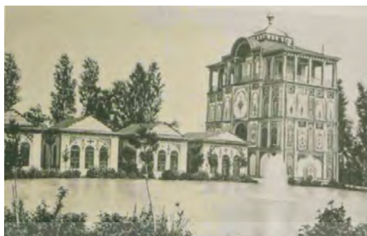
تصویر شماره ۶: باغ عشرت‌آباد.

چند شیر و ببر قیمتی در اطاق‌های مخصوص در این باغ، وجود دارد و از قرار معلوم سابق بر این کرگدنی در این باغ بوده که شاه او را خیلی دوست داشته است (همان: ۳۷۰).