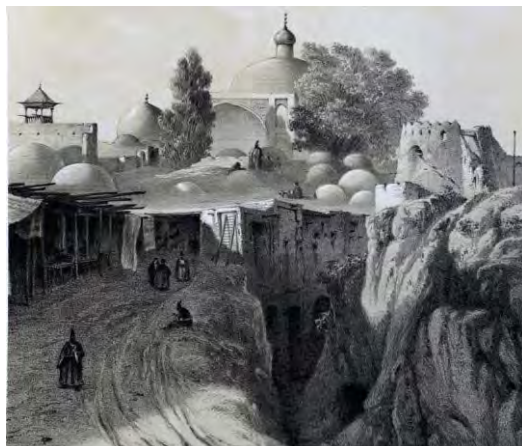
تصویر شماره ۳: تهران ترسیم شده توسط کلاویخو.