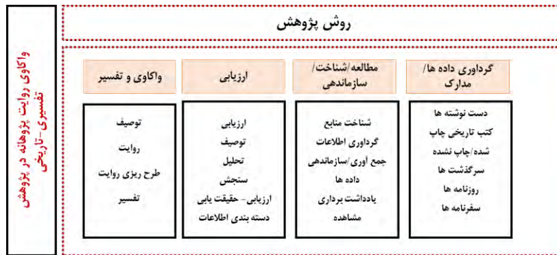
تصویر شماره ۱: ساختار کلی پژوهش.