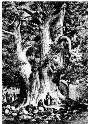
تصویر شماره ۷: تصویر سمت راست: کاخ نایب‌السلطنه ترسیم شده در سفرنامه دیولافوا. مأخذ: (دیولافوا، ۱۳۷۱، ۱۷۶)، تصویر سمت چپ: چنارهای بزرگ تجریش، ترسیم شده در سفرنامه دیولافوا. مأخذ: (همان، ۱۷۰)

اعتمادالسلطنه در سال ۱۲۵۵ ش / ۱۸۷۶ م درباره عمارت خروجی می‌نویسد: «عمارت و باغ مخصوص همایونی است که در حقیقت بیست سال است متصل در آن کار می‌شود و این باغ بزرگ را یک عمارت طولانی دورو از وسط به دو قسمت کرده که به همدیگر از زیر این عمارت یعنی درهای عالی و حوض‌خانه‌های مزین راه دارند و در این عمارت طولانی، تالار آینه گلستان واقع است که کلاً آینه و چهار ستون دارد (اعتمادالسلطنه، ۱۲۵۵).