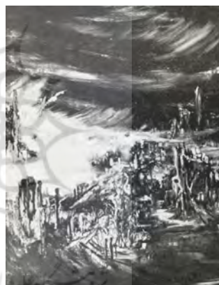
تصویر (۲) اثر ایران درودی