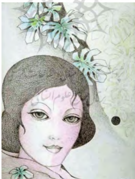
تصویر (۸) اثر طلیعه کامران