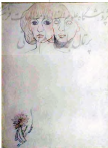
تصویر (۱۲) اثر پروانه اعتمادی