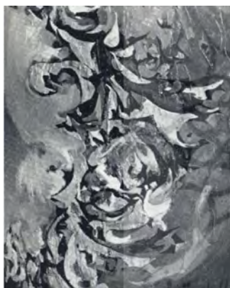
تصویر (۳) اثر منصوره حسینی