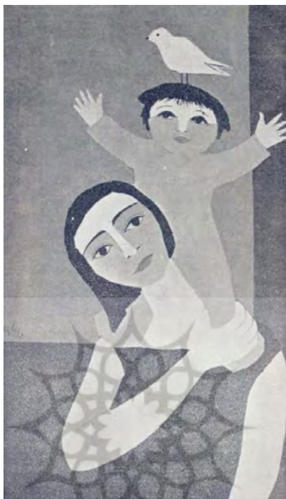
تصویر (۱۱) اثر لیلی متین دفتری