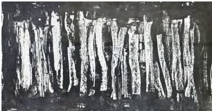
تصویر (۱) اثر بهجت صدر