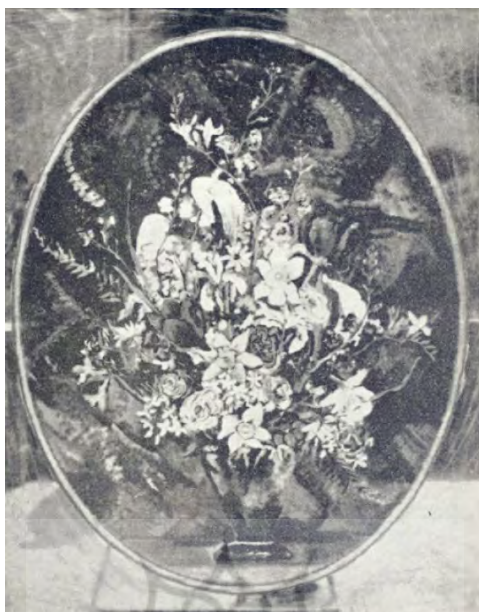
تصویر (۷) اثر منیر فرمانفرمایان