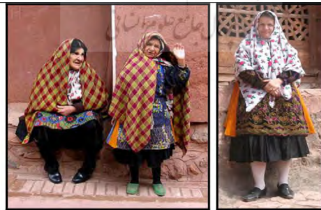
تصاویر ۲ و ۳: لباس سنتی زنان ایبانه

در استان اصفهان پیراهن تن جامه اصلی است که غالباً همراه با دامنی کوتاه و پرچین و همراه با شلوار استفاده می‌شده است. در منطقه ایبانه، تن جامه زنان، پیراهن راسته و گشاد با بلندی تا بالای زانو است. شلیته یا دامن نیز گشاد بسیار پرچین (حدود هفت تا هشت متر پارچه) و به بلندایی تا وسط ساق پا است. یل یا کتی راسته و بلند نیز تن جامه رویی زنان ایبانه است. روسری (چارقد) نیز پارچه‌ای چارگوش و بزرگ (۱/۵×۱/۵ متر) است که با سربند بر روی سر استوار می‌ماند. چادرشب یا «کجی» نیز پارچه شطرنجی و چارگوش به ابعاد ۲×۲ متر است که به صورت سه گوش دور کمر بسته یا روی سر انداخته می‌شود (تصاویر ۲ و ۳).