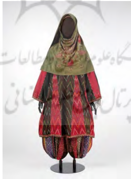
تصویر ۴: لباس سنتی زنان زرتشتی

پیراهن سنتی زنان زرتشتی بر دو گونه رویی و زیرین است. پیراهن زیرین کوتاه و پیراهن رویی با بلندایی تا ساق پا است. پیراهن رویی از قسمت زیر سینه تا پایین ترک‌هایی دارد که در ترکیبی رنگارنگ در کنار هم قرار می‌گیرند. رنگ لباس‌ها نیز در فام‌های سبز و زرد به‌کرات دیده می‌شود البته رنگ زرد رایج در لباس سنتی زنان زرتشتی در یزد شاید متأثر از اجبار حکومتی دوران عباسیان در استفاده از آن در متمایزسازی زرتشتیان از مسلمانان بوده باشد (چوکسی، ۱۳۸۱: ۱۶۲). شلوار از جمله پاجامه‌های زنان زرتشتی در یزد نیز برش‌های متعدد دارد. پاجامه‌های شلوار از تکه‌های باریک، رنگارنگ و نقش‌داری تشکیل شده است که در کنار یکدیگر دوخته می‌شود. دمپا و کمر این شلوار گشاد در قسمت کمر و مچ پا با بند بسته می‌شود (تصویر ۴).