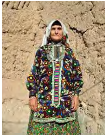
تصویر ۱: لباس سنتی زنان کرمان

در استان اصفهان پیراهن تن جامه اصلی است که غالباً همراه با دامنی کوتاه و پرچین و همراه با شلوار استفاده می‌شده است. در منطقه ایبانه، تن جامه زنان، پیراهن راسته و گشاد با بلندی تا بالای زانو است. شلیته یا دامن نیز گشاد بسیار پرچین (حدود هفت تا هشت متر پارچه) و به بلندایی تا وسط ساق پا است. یل یا کتی راسته و بلند نیز تن جامه رویی زنان ایبانه است. روسری (چارقد) نیز پارچه‌ای چارگوش و بزرگ (۱/۵×۱/۵ متر) است که با سربند بر روی سر استوار می‌ماند. چادرشب یا «کجی» نیز پارچه شطرنجی و چارگوش به ابعاد ۲×۲ متر است که به صورت سه گوش دور کمر بسته یا روی سر انداخته می‌شود (تصاویر ۲ و ۳).