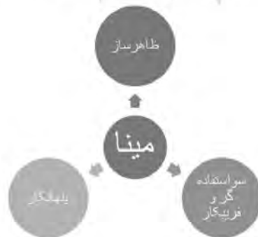
نمودار شماره ۷ - ویژگی‌های هویتی مینا

مینا (پرستار شیرین): او را در فیلم به اندازه سایر شخصیت‌ها نمی‌بینیم، اما تأثیر زیادی در درون‌مایه شخصیتی محسن و سادگی یاسی دارد. کسی است که به خانه محسن و یاسی رفت و آمد دارد و از جزئیات زندگی آنها آگاه است؛ یعنی در مکانی که باید مأمونی باشد برای آرامش و پوشیده بودن روابط و رازهای زندگی خانواده محسن، با رابطه پنهانی‌ای که با محسن برقرار کرده توانسته است به همه چیز احاطه پیدا کند. حتی اوست که خبر بارداری یاسی را به محسن می‌دهد. رفتارش با یاسی ظاهرسازی شده است و نقش بازی می‌کند و او را فریب می‌دهد. در واقع از اعتماد یاسی به خود کاملاً سوءاستفاده می‌کند. با این احوال، رفتار ظاهرسازی شده و فریبکارانه محسن نیز به حدی است که از یاسی می‌خواهد پرستار را عوض کند. دال‌های ارزشی مینا و محسن به هم شباهت‌های بسیاری دارد.