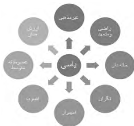
نمودار شماره ۲ - ویژگی‌های هویتی یاسی

علی: استاد دانشگاه و تنها فردی است که در این میان تازه‌وارد است؛ یعنی مانند سایر افراد مهمانی با آنها سابقه دوستی ندارد، ولی مذهبی، مضطرب و دروغ‌گوست. شکاک و تعصبی بودنش هم در رفتارش و هم در گفتارش نمایان است. خانه جدیدش را می‌خواهد با پرده بپوشاند تا زنش از دیدها پنهان باشد. به برخی کنش‌های لاله حساس است و اوقاتش تلخ می‌شود. فردی است حساس که از لاله انتظار چنین پنهان‌کاری‌هایی را ندارد. اصلاً خوددار نیست و بعد از متوجه شدن دروغ‌های لاله و سقط بچه، اوج عصبانیتش را با کتک زدن و خشونت آشکار و اشک ریختن نشان می‌دهد. در واقع این‌طور به مخاطب حرف آخر را می‌زند که در آن جمع از همه غریبه‌تر و با همه متفاوت‌تر است و در آخر هم آن جمع را ترک می‌کند.