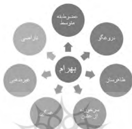
نمودار شماره ۵- ویژگی های هویتی بهرام

پوشش گرفته تا رفتارش که شامل شوخ طبعی و آواز خواندن می شود- نقابی بر روی حسرت هایش بکشد. بهرام در ابتدا به تهمینه برای قرض دادن پول به محسن دروغ می گوید، اما وقتی با تهمینه تنها می شود دیگر ابایی از مخفی کردن این حرف ندارد و حقیقت را می گوید.