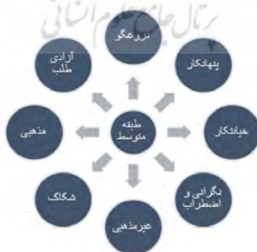
نمودار شماره ۹

از میان شخصیت‌های فیلم محسن، یاسی، علی، لاله، بهرام و پرستار بچه را به خاطر برخی ویژگی‌های مشترکی که دارند می‌توان در یک طبقه اجتماعی متوسط جای داد. در مقابل تهمینه به خاطر برخی ویژگی‌های متمایزش عضوی طبقه بالا قرار می‌گیرد. با کمک منطق هم‌ارزی می‌توان به بررسی ویژگی‌هایی پرداخت که فیلم به طبقه متوسط نسبت می‌دهد. بر این اساس، اگر ویژگی‌های کلیه این شخصیت‌ها را در کنار هم بگذاریم به نمودار شماره ۹ خواهیم رسید: