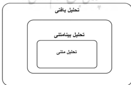
شکل ۱: مراحل سه‌گانه نشانه‌شناسی گفتمانی

مرحله سوم تحلیل بافت اجتماعی است که بر اساس آن با رجوع به خارج از حوزه سینما، تبیینی کلان‌تر از منظر روشنفکران اجتماعی و فرهنگی داده می‌شود و رابطه اثر هنری را با فضای بزرگ‌تری که آن را در بر گرفته است مشخص می‌شود. این سه سطح تحلیل را به این شکل نشان داده است: