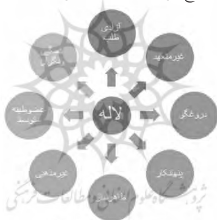
نمودار شماره ۴ - ویژگی‌های هویتی لاله

لاله: وقتی به بررسی ویژگی‌های شخصیتی و دال‌های ارزشی لاله می‌پردازیم او را زنی می‌یابیم از طبقه متوسط که از لحظه‌ای ورودش به فیلم سعی در پنهان‌کاری دارد. مدام برای رسیدن به هدفش که سفری خارجی است برای همسرش نقش بازی می‌کند، از نظر روحیات با همسرش علی تفاوت‌های اساسی دارد، غیرمذهبی و غیرمتعهد به حقوق اوست. به‌صورت پنهانی با کمک یاسی و ته‌مینه بچه‌اش را سقط کرده است و با کمک بهرام ویزای سفرش به آلمان را که در همان شب مهمانی به دستش می‌رسد و آن را از چشم همسرش پنهان می‌کند، فراهم کرده است. آزادی‌طلب و علاقه‌مند به غرب است. گرایش و کنش وطن‌دوستی ندارد. ناراضی است از اینکه علی این چنین نسبت به او حساس است. از علی و فاش شدن رازش به‌شدت می‌ترسد و برای آرام کردن علی، دروغ می‌گوید و کمک می‌گیرد و از او دوری می‌کند.