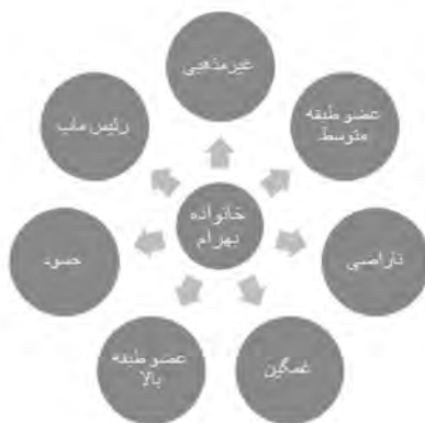
نمودار شماره ۸ - ویژگی هویتی خانواده بهرام

نوعی لجاجت تبدیل شده است و در هیچ‌یک قصد کوتاه آمدن را نمی‌بینیم. این طور مخاطب در آخر برداشت می‌کند که این دو از یکدیگر جدا خواهند شد.