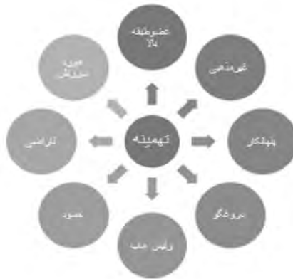
نمودار شماره ۶ - ویژگی‌های هویتی تهمینه

مینا (پرستار شیرین): او را در فیلم به اندازه سایر شخصیت‌ها نمی‌بینیم، اما تأثیر زیادی در درون‌مایه شخصیتی محسن و سادگی یاسی دارد. کسی است که به خانه محسن و یاسی رفت و آمد دارد و از جزئیات زندگی آنها آگاه است؛ یعنی در مکانی که باید مأمونی باشد برای آرامش و پوشیده بودن روابط و رازهای زندگی خانواده محسن، با رابطه پنهانی‌ای که با محسن برقرار کرده توانسته است به همه چیز احاطه پیدا کند. حتی اوست که خبر بارداری یاسی را به محسن می‌دهد. رفتارش با یاسی ظاهرسازی شده است و نقش بازی می‌کند و او را فریب می‌دهد. در واقع از اعتماد یاسی به خود کاملاً سوءاستفاده می‌کند. با این احوال، رفتار ظاهرسازی شده و فریبکارانه محسن نیز به حدی است که از یاسی می‌خواهد پرستار را عوض کند. دال‌های ارزشی مینا و محسن به هم شباهت‌های بسیاری دارد.