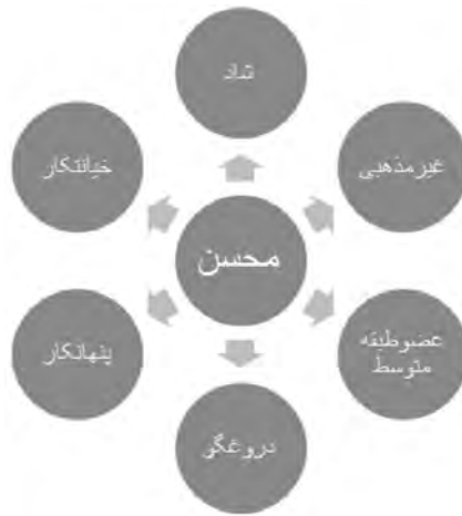
نمودار شماره ۱ - ویژگی‌های هویتی محسن

یاسی: بررسی شخصیت یاسی به‌عنوان دالی مرکزی ما را به دال‌های ارزشی زیر می‌رساند: ۱