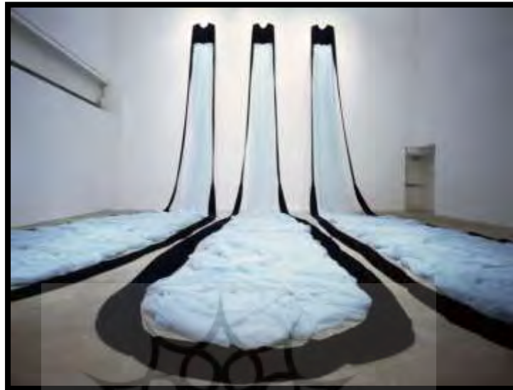
شکل ۱. لباس‌های شب آبی ۱ ، ۱۹۹۳، (بورلی سیمز استودیو ۲ ، بدون تاریخ)

اکنون لباس که تجلی‌بخش جایگاه مفهومی در دنیای هنر معاصر است، همچون الگوی آثار هنری، جایگاه گفتمان را از ورای لباس معرفی می‌کند. لباس‌هایی که در آن‌ها، همان‌طور که راسل (۲۰۰۸) به درستی به آن اشاره دارد، سه عامل بدن، فضا، و ارتباط حائز اهمیت می‌شوند. در نتیجه، در این حالت لباس مستقیماً یک اثر هنری تلقی می‌شود و طراح لباس هنرمندی است که آثارش را با کارمادهای مثل لباس خلق می‌کند؛ اما این بار از دید کاربردی فراتر می‌رود و آن را به صورت رسانه مطرح می‌کند (بزرگمهر و محمدی، ۱۳۸۹). در واقع، لباس مفهومی فوران خلاقیت و اندیشه هنرمند است که درک آن از سوی مخاطب بنیة فرهنگ و روان خالق آن را مشخص می‌کند (تصویر ۲).