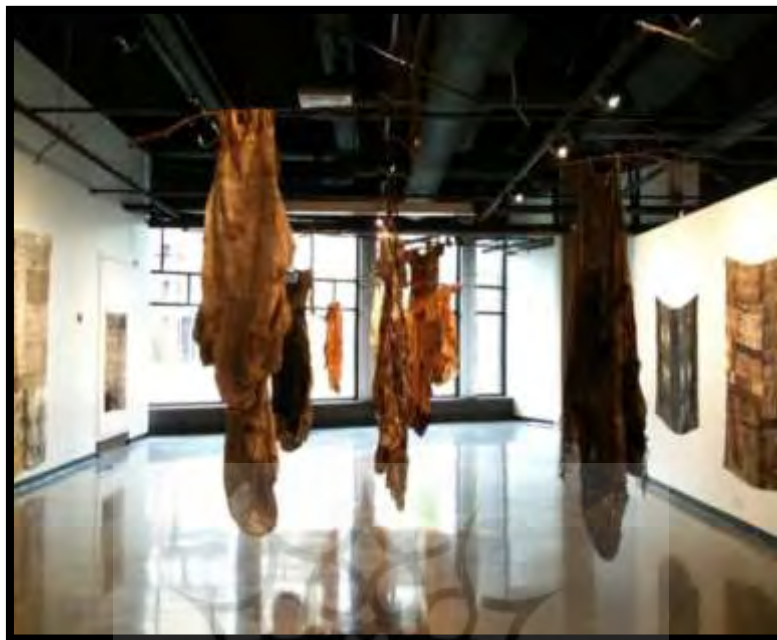
تصویر ۲. ایندیا فلینت، پوست دوم، ۲۰۱۱، (سایت ایندیا فلینت، ۲۰۱۲)

استفاده از لباس مفهومی به‌عنوان یک اثر تجسمی، آن را از نگرش خاص خود، یعنی نگرش کاربردی، رها می‌کند و سبب می‌شود تا به کارکرد بازنگریسته شود. با توجه به این موضوع که لباس برخاسته از فرهنگ عامه است و به‌خوبی با مخاطب ارتباط برقرار می‌کند، ما شاهد معرفی و تثبیت آن به‌عنوان ابزار بیان هنری هستیم؛ ابزاری که هنرمند مفهوم‌گرا با استفاده از آن به بیان ایدئولوژی، نقد اجتماعی، فرهنگی، یا دیگر مسائل پیرامون خود و به‌طور کلی دغدغه‌های درونی خود می‌پردازد (جوادی یگانه و کشفی، ۱۳۸۶). و اینجاست که جنبه زیبایی‌شناسانه لباس کنار می‌رود و مفهوم نهفته در آن اهمیت می‌یابد؛ لباسی که حاکی از نگرش عمیق به اطراف و حتی درون افراد است و در آن مخاطب به تفکر واداشته می‌شود (آیت‌اللهی و فربود، ۱۳۸۵).