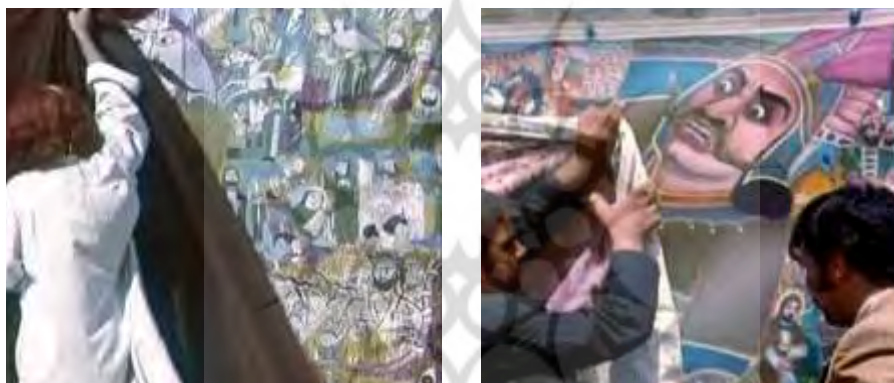
قاب ۱۰. بستن و بازکردن پرده

دلیل بسته‌ماندن پرده و بازشدن گه‌گاهی آن این است که چیز مهمی در پرده وجود دارد که نباید همواره نمایش داده شود، بلکه بهتر است برخی اوقات، یعنی به هنگام پرده‌خوانی، نشان داده شود (قاب ۱۰). پرده صرفاً به‌سبب اینکه دارای نقوشی است و نقاشی شده، ارزش فرهنگی اعتقادی دارد. ارزش آن عبارت است از اینکه پرده چیزی علاوه بر خود پرده دارد و آن چیز با «اعتقاد» به‌وجود می‌آید. همان چیزی که با اعتقاد در مکان‌های مقدس به‌وجود می‌آید: نیرو. شمایل‌های پرده دارای نیرویی هستند که قدرت تأثیرگذاری دارند.