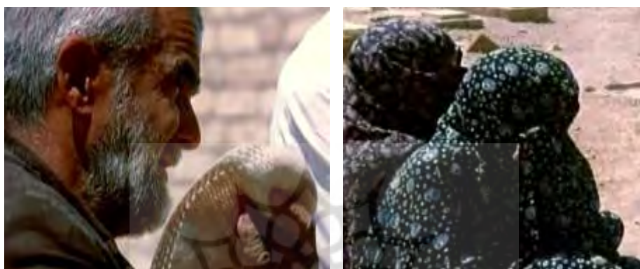
قاب ۸. هم‌حسی با روایت تراژیک (عکس‌ها از آفریده، ۱۳۹۱)

است. هنگام گریه گوش می‌شنود اما چشم بسته است. چیزهایی که از دهان پرده‌خوان گفته می‌شوند وارد گوش می‌شوند و در جهان درونی فرد تبدیل به انواع تصویرسازی‌ها می‌گردند. دیگر پرده در چشم‌ها نیست و شاید بخش‌هایی از آن وارد انواع تخیلات ذهنی شده که می‌تواند ابعاد چندحسی فراتری از ظواهر داشته باشند؛ همچون عطش دهانی، بوی خون، صدای جنگاوری‌ها، لمس زخم، و غیره. بدین ترتیب چندحسی‌سازی استراتژی‌ای است که ابعاد موضوع را می‌گشاید.