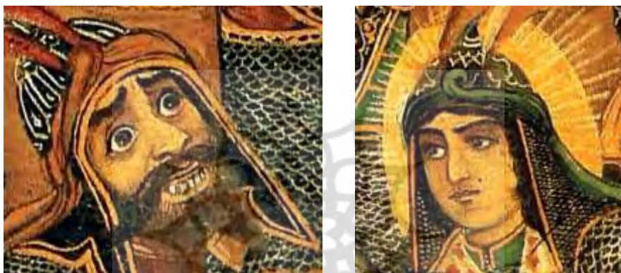
قاب ۵. صورت‌های زیبا و زشت (عکس‌ها از آفریده، ۱۳۹۱)

۳. صورت‌های زشت و زیبا. علاوه بر اینکه صورت‌ها حالت‌های هیجانی خشمگین یا مهربان دارند، به قول یک پرده‌خوان: «این صورت‌ها زشت و زیبا داره»، هنرمند تلاش می‌کند زشتی و زیبایی را نیز در همین صورت‌ها بیان کند. مخاطبان از پرده‌خوان می‌پرسند که «چرا شمر دندوناش این‌طوری درومده، آقا ابالفضل انقدر زیباست؟» (قاب ۵). درواقع، بد و خوب بودن شخصیت‌ها در شکل ظاهر آن‌ها نیز تجسم می‌یابد. بدین ترتیب، بی اینکه فردی از شخصیت‌های پرده اطلاعی داشته باشد، صرفاً با دیدن صورت زشت یا صورت زیبا می‌تواند تشخیص بدهد که کدام بد و کدام خوب است. بدین طریق مفاهیم بدی و خوبی شکل قابل مشاهده‌ای می‌یابند و ادراک حسی در حس بینایی واسطه‌ای است که از طریق آن این مفاهیم قابل فهم می‌شوند و انتقال می‌یابند.