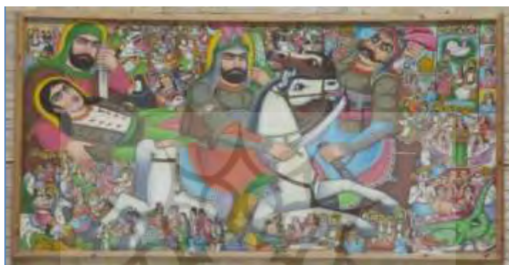
قاب ۲. حجم تصویر، پرده نصب‌شده بر سازمان میراث فرهنگی (عکس از نگارنده، دی ۱۳۹۲)

پرده و برخورد آن‌ها با چشم در یک لحظه ورود یا به عبارت بهتر تهاجم دیداری آن‌ها به چشم را نمادین و در واقعیت عملی می‌کند. همچون تأثیری افسون‌کننده و تکان‌دهنده تصاویر بر چشم مخاطب می‌افتند، اما این فقط چشم نیست که تحت تأثیر قرار می‌گیرد، بلکه کلیت بدنی فرد زیر فشار قرار می‌گیرد. بنابراین، دیدن فقط دیدن نیست، بلکه تجربه‌ای بدنمند ۱ است که ظاهر یا رنگ‌ها و طرح‌ها را به تجربه‌ای کلیت‌یافته در سراسر کالبد جسمانی بدل می‌کند. فشار دیداری می‌تواند نشان‌دهنده اهمیت موضوعی باشد که در مراسم پرده‌خوانی درباره آن بحث خواهد شد.