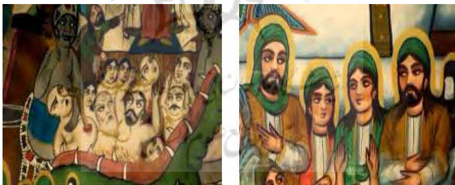
قاب ۶. فیگورهای آرام و متلاطم

۴. فیگورهای آرام و متلاطم. اگر از تحلیل صورت‌ها بگذریم، باید حالت‌های کل بدن به‌ویژه در وضعیت‌های دسته‌جمعی را مد نظر قرار دهیم. فیگورهای جمعی بسیار مهم عبارت‌اند از: صحنه‌ی جهنم، صحنه‌ی امامان (قاب ۶). صحنه‌ی جهنم در دهان ماری با دندان‌های درنده‌ای تجسم یافته که افراد برهنه‌ای با عقرب‌هایی در حال عذاب کشیدن هستند. تأثیر هیجانی این صحنه ترس زیادی است که به بیننده منتقل می‌شود. این صحنه چنان وحشت‌انگیز نقاشی شده که مخاطب را به‌طور واقعی بترساند: ترس از عاقبت بد اعمال بد. تصویر جهنم گرچه صرفاً تصویر است اما تجربه‌ای هیجانی را پدید می‌آورد که فرد را تحت تأثیر قرار می‌دهد تا درک کند که او نیز ممکن است زمانی گرفتار مار و عقرب جهنم شود. تأثیر این فیگورهای جمعی بسیار بیشتر از صورت‌های فردی است. صورت‌های فردی زشت حالت‌های فعالی هستند، ولی فیگورهای جمعی حالت‌های انفعالی را نشان می‌دهند؛ انفعالی که بر اثر تحت عذاب قرار گرفتن به‌وجود می‌آید. در حالت انفعالی نیرویی از بیرون (که مار و عقرب ابزارهای آن هستند) بر فیگورها وارد شده است و بیننده نیز می‌تواند فشار این نیروی بیرونی را درک کند؛ کششی که از مجرای چشم وارد می‌شود اما کل بدن را در خود می‌بلعد. مجدداً تأثیر از یک حس دیداری تبدیل به تأثیر در حس عضلانی می‌شود. عضلانی‌شدن تصویر خود نشان‌دهنده‌ی یک انتقال ادراکی است: یعنی تصویر فقط دیده نمی‌شود، بلکه با عضلات درک هم می‌شود. این ادراک عضلانی معنایی فرهنگی در پی دارد و آن گرفتاری در مار و عقرب جهنم است.