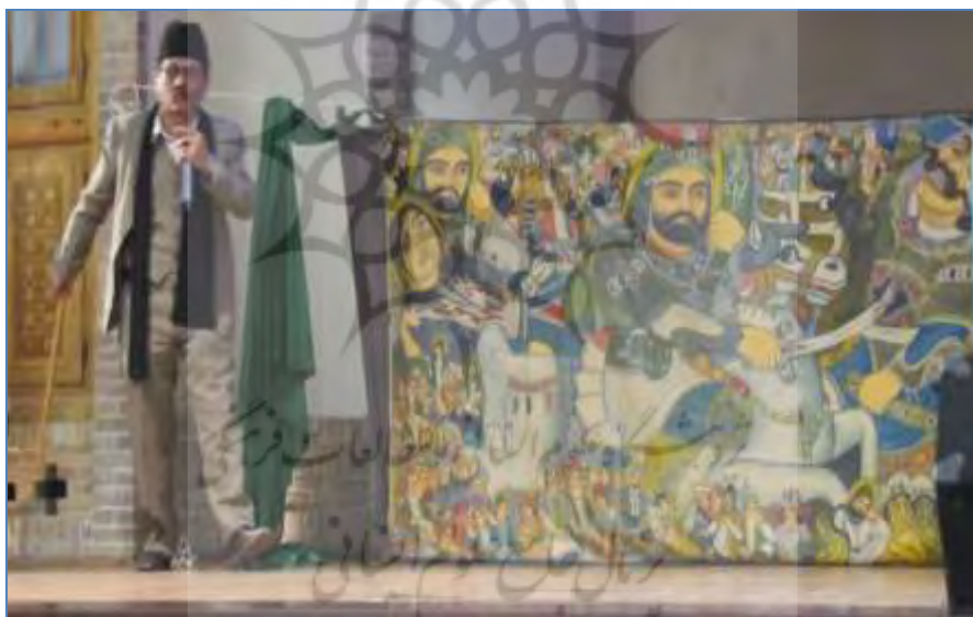
قاب ۱. پرده خوانی، تبریز، دانشگاه هنر اسلامی تبریز (عکس از نگارنده، اسفند ۱۳۹۱)

پرده خوانی را «شمایل گردانی»، «پرده برداری» (بیضایی، ۱۳۴۴)، و «خیالی‌نگاری» (پاکباز، ۱۳۸۶) نیز نامیده‌اند. سابقه و پیشینه پرده خوانی را نیز به دوره‌های پیش از اسلام در قالب نقالی موسیقایی و آوازی می‌رسانند. بر اساس نظر برخی از محققان از نمایش پرده خوانی برای تهییج سپاهیان ایران هم بهره می‌برده‌اند (عنصری، ۱۳۶۶). نقاشی‌های پرده را از نوع نقاشی قهوه خوانی (بلوکباشی، ۱۳۷۵) و با توجه به مضمون آن نقاشی کربلا نیز دانسته‌اند (پیترسون، ۱۳۶۷). مباحث تاریخی متفاوت و متنوعی درباره ریشه‌ها و تأثیرات این هنر در گرفته است (ر ک میرفخرایی، ۱۳۸۳). پرده خوانی در نقاط گوناگون ایران در دوره‌های گذشته به‌ویژه پس از دوره صفویه رونق زیادی داشته است، اما اکنون عده کمی از پرده خوانان باقی مانده‌اند. در دوره‌های گذشته، پرده خوانی در میان عامه مردم برگزار می‌شد، اما اکنون با افول آن، شاهد اجرای آن در مناسبت‌ها و مکان‌های خاصی همچون جشنواره‌ها، سمینارها، و غیره هستیم (قاب ۱).