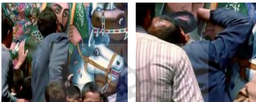
قاب ۹. لمس کردن تصویر

با این کار همه اعضای حسی درصدد واردکردن چیزی قدسی از جهان بیرون به جهان درون هستند. وقتی این چیز قدسی وارد بدن می‌شود، فرد نیز واجد ویژگی‌های قدسی می‌شود. به همین دلیل است که تا حد زیادی بر روبوسی و هم‌آغوشی با زائران مکان‌های مقدس تأکید می‌شود، زیرا تصور بر آن است که فرد زائر به دلیل تماس جسمانی و به‌ویژه تماس بساواپی با اشیای موجود در مکان زیارت، کیفیت‌های مربوط به موضوع زیارت را به بدن خود چسبانده یا خورنده است و بنابراین فرد غیرزائر می‌تواند با بوسیدن صورت یا لمس کردن بدن زائر آن ویژگی‌ها را به خود بچسباند و بخوراند.