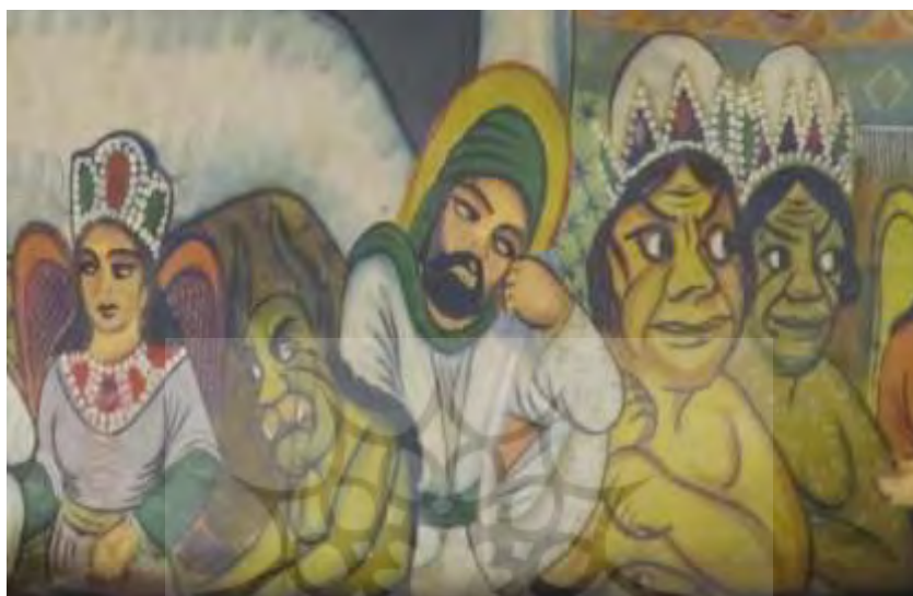
قاب ۳. صورت‌های هیجانی (اسفند ۱۳۹۱)

آرامش‌های دیداری می‌شود و بدین ترتیب معانی حسی پدید می‌آیند. محرک دیداری آرام و محرک دیداری متلاطم به تأثرات هیجانی مرتبطی تبدیل می‌شوند و این تأثرات آرامش‌بخش و تلاطم‌آفرین ارزش‌های حسی خود را در پی دارند: آرامش‌داشتن و متلاطم‌بودن.