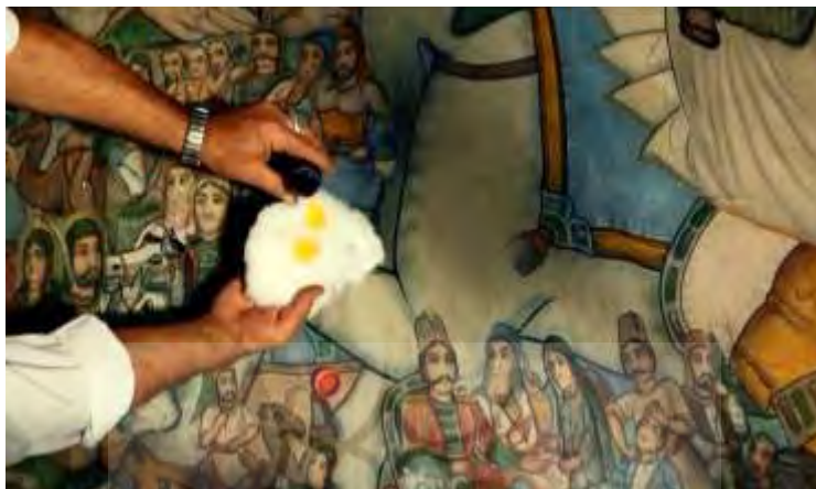
قاب ۷. روغن‌زدن پرده (عکس از آفریده، ۱۳۹۱)

چرخش درمی‌آورد. او همواره پرده را در خانه لمس می‌کند و از طریق ارتباط بساوایی با پرده قادر می‌شود ارتباطی صمیمی و از نزدیک با شمایل‌ها نیز برقرار کند؛ شمایل‌هایی که نقش کلیدی در زندگی این جهانی و آن جهانی او دارند.