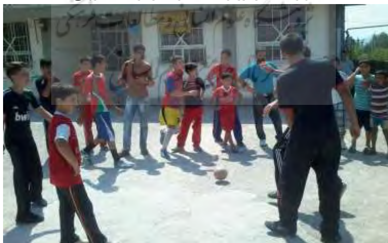
تصویر ۲: انتقال ارزش‌های مشترک در بازی‌های گروهی