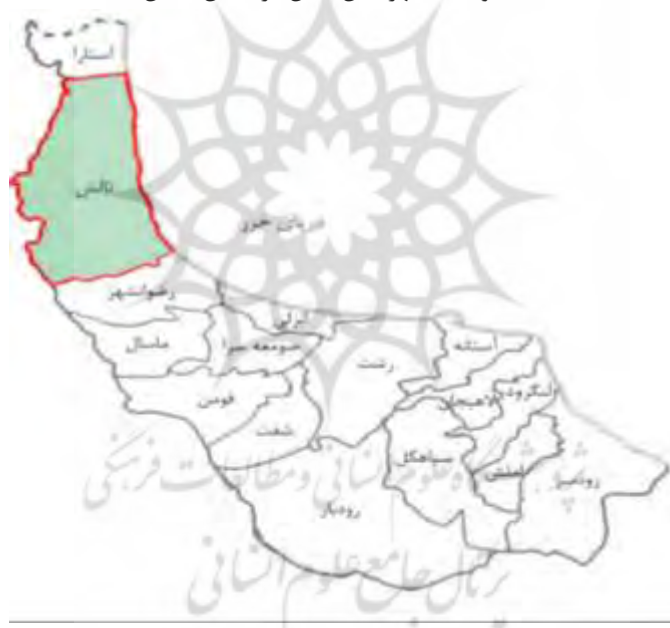
نقشه ۱: موقعیت شهرستان تالش در استان گیلان