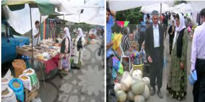
تصویر ۱: بازارها عرصه مبادله بین اقوام مختلف