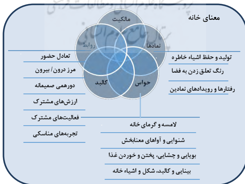
نمودار ۲: مولفه‌های معنا ساز خانه

نکته‌ای که در اینجا می‌بایست مورد تأمل قرار گیرد، نقش پررنگ روابط اجتماعی در معنادگی به خانه، در مقابل نقش تقریباً انکار شده کالبد آن است. در ظاهر، روایت فیلم‌ها از خانه، بیش از اندازه ایده‌آلیستی به نظر آمده و گویی از این پنداره دفاع می‌کند که خانه بیش از هر چیز، حاصل روابط انسانی اعضای آن با یکدیگر است و به عبارت دیگر، با روابط انسانی خوب می‌توان، هر فضایی با هر کیفیت محیطی را تبدیل به خانه کرد و معماری و ویژگی‌های کالبدی فضا در آن نقش مؤثری ندارد. نکته جالبی که در کتاب کوپر مارکوس بر آن تأکید شده است، اشاره به نمای بیرونی خانه، به صورت برجسته، در فیلم‌ها و توجه اغلب پژوهشگران در حوزه‌های مختلف علمی به آن است (مارکوس کوپر، ۱۹۹۷: ۹). این نمای بیرونی می‌تواند نمایش‌دهنده جایگاه یا موقعیت اجتماعی صاحب‌خانه باشد. درحالی‌که در چهار فیلم بررسی‌شده چنین نمایی دیده نمی‌شود و فضای داخلی خانه و متعلق‌تتش، به عنوان آینه‌ای از خودِ درونی، مورد توجه قرار گرفته‌اند. برای بسیاری از مردم، مبلمان، تصاویر و دیگر اشیاء متحرک خانه، بیان بسیار قدرتمندی از «خود» هستند تا ساختار خانه به تنهایی. نکته کلیدی در درک این موضوع، شخصی‌سازی فضا است. همان‌گونه که در داستان‌های نقل‌شده از مصاحبه‌شوندگان در کتاب کوپر مارکوس، اشیاء متحرک خانه، بیش از کالبد فیزیکی «نمادهای خویشتن» هستند (مارکوس کوپر، ۱۹۹۷: ۸).