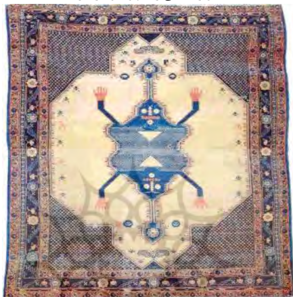
تصویر ۳: قالی رستم و دیو، فراهان

توده مردم (زرین کوب، ۱۳۸۳: ۸۲) بر تن می‌کرده است. روایت دیگر، افسانه‌های مربوط به دیو و شیطان است که ممکن است بافنده در ادبیات شفاهی با آن روبه‌رو شده و با خیال‌پردازی ایرانی در فرش تصویر کرده باشد. در درخت واق بختیاری، تصویر صورت دیوسان فراز ستون‌ها شباهت درخوری با فرش سینه دارد و شاید نمادی از شیر باشد (هالی، ۱۹۹۹: ۷۰-۷۱).