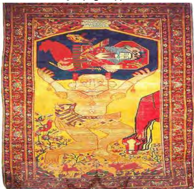
منبع: هالی، زانویه ۱۹۹۹

ممکن است چنین روایتی نیز قابل قبول باشد که قرائت و نقالی بعضی داستان‌های کتب قدیم ادبیات ایرانی نظیر شاهنامه یا کتب مذهبی، اندیشه خیال‌پردازی‌های ژرف و خلاقانه هنرمند قالی‌باف ایرانی را به خلق این تصاویر هدایت کرده باشد. همچنین از آن حیث که اشکال انسانی و حیوانی نقش شده بر درخت واق و جوه مشابهتی با تصاویر ستارگان و اجرام سماوی دارند، می‌توان فرضیه ارتباط این درخت با نجوم را نیز مطرح کرد.