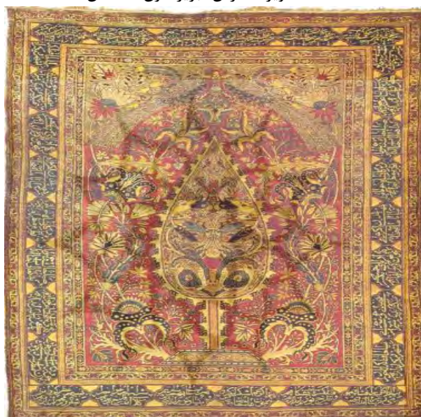
منبع: رویای بهشت، جلد ۲: ۲۳

تفسیر نامی پتگر نیز از آن حیث که وجوه مشابهتی با مضامین مذهبی کتاب معاد اثر آیت‌اله دستغیب دارد حایز اهمیت است. از جمله مضامین مورد اشاره در کتاب فوق طریقه سربرآوردن کفار و مومنین از قبر در روز حشر است که قابلیت همسان‌سازی با الگوهای نقش‌پردازی واق را دارد (دستغیب، ۱۳۶۰: ۹۳). پتگر در مورد فرش تصویر شده در همین مقاله یعنی درخت واق ابریشم بافت هریس از مجموعه خصوصی حکیمیان، همچون درخت جان یاد می‌کند که نقش آن نمادی از پنجره‌ای گشوده به درون وجود انسانی است و هر حیوانی در آن نمادی از انرژی‌های درونی جان انسان به حساب می‌آید (حصوری، ۱۳۸۲: ۱۰۱-۱۰۰). در تالیفات غربی از منظر اسطوره‌ای درخت سخنگو بدان پرداخته می‌شود.