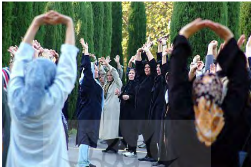
تصویر ۲: ورزش بانوان در پارک بانوان

شادابی می‌کند. ورزش موجب افزایش اعتماد به نفس و در نتیجه موجب افزایش کارایی فرد در مسئولیت‌های زندگی و اجتماعی ظاهر شود.