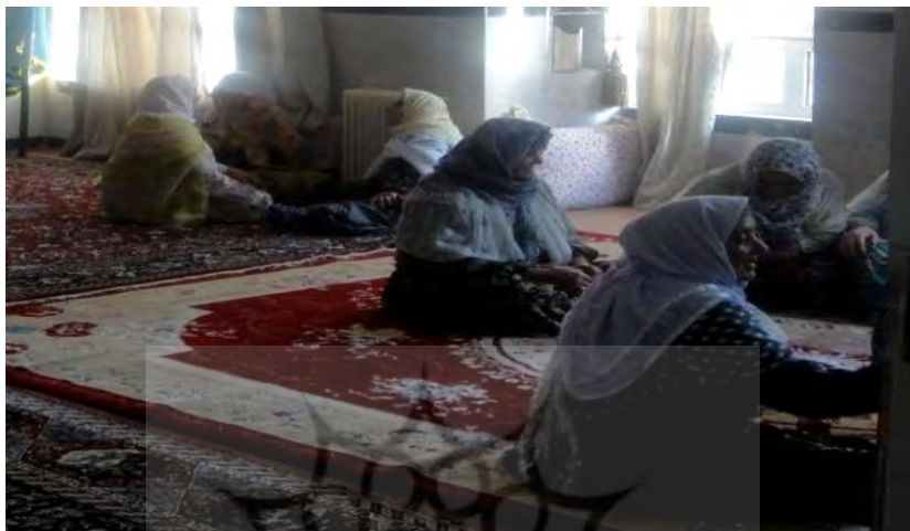
منبع: مریم بیان علایی حسینی، بهار ۱۳۹۰

عکس ۳: زنان در حال گفتگوهای دوستانه در حاشیه مراسم، خانقاه شیخ محمد بهاء‌الدین نقشبندی