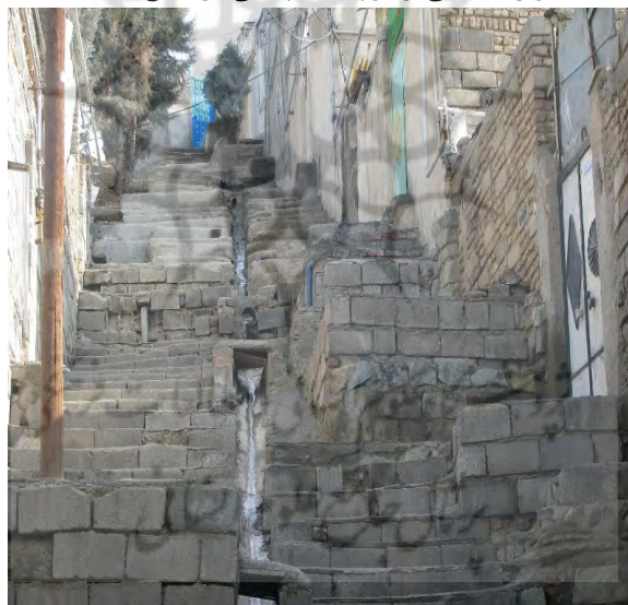
منبع: نگارنده، آذر ماه ۱۳۸۸

رد شدن از خیابان اصلی پر تردد هم خطر دیگری ست. علی‌رغم وجود یک پل عابر پیاده، هیچ کس از آن استفاده نمی‌کند، چون دانش‌آموزان در سطح محله از کوچه‌های پلکانی پرشیب بالا و پایین می‌روند و از استفاده از پل عابر پیاده صرف نظر می‌کنند. این در حالی است که ساکنان بخش بالایی (سه راه موتورسوار به بالا) که اغلب از فروشندگان مواد هستند، فرزندانشان را در مدارس عموماً غیرانتفاعی داخل شهر کرج ثبت‌نام کرده‌اند و