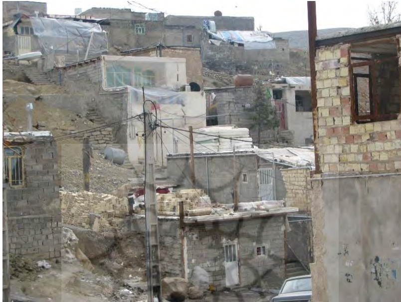
تصویر ۱: نمایی از منطقه حصار خط چهار

فاضلاب خانه‌ها از وسط کوچه‌ها عبور می‌کند و همیشه یک جوی مملو از کف در کوچه جاری است. تعداد زیادی از ساکنان همیشه در حال تعمیر خانه‌ها یا اضافه کردن یک اتاق بر روی پشت‌بام برای اجاره دادن آن و کسب درآمد بیشتر هستند.