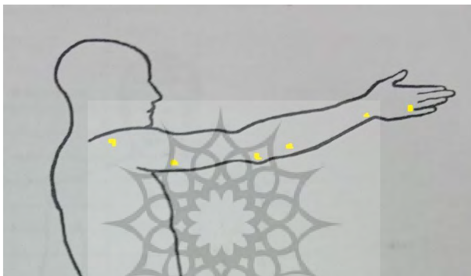
شکل ۲- نحوه مارک گذاری در مفاصل مچ، آرنج و شانه

هستند. در مجموع، شش مارکر روی دست راست شرکت‌کننده‌ها به روش plug in در نقاط آناتومیک پنجمین مفصل کف دستی انگشتی (ناحیه پروکسیمال انگشت کوچک)، زائده داخلی مچ دست و بخش میانی و خارجی ساعد، اپی‌کندیل خارجی بازو در مفصل آرنج و بازو زائده آخرومی شانه قرار گرفت.