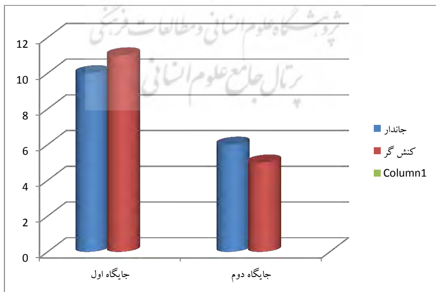
نمودار ۲- مقایسه تأثیر ویژگی جاننداری و کنش‌گری بر آرایش جمله در بخش کتبی