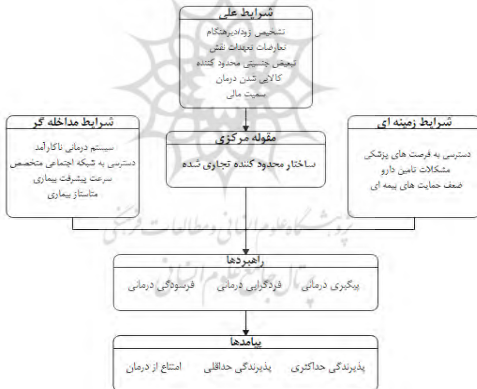
شکل ۲. مدل پارادایمی رفتار درمانی در بیماران مبتلا به سرطان پستان

مدل پارادایمی مستخرج از مطالعه در شکل ۲ آمده است. آنچه‌آنکه مدل پارادایمی نشان می‌دهد شرایط علی در تعامل بین شروط زمینه‌ای و مداخله‌گر ممکن است سه راهبرد اصلی درمانی در زنان مبتلا به سرطان پستان ایجاد کنند: پیگیری درمان، فردگرایی درمانی یا فرسودگی درمانی. این تعاملات در نهایت سه پیامد رفتاری برای مبتلایان ایجاد می‌کند: پذیرندگی حداکثری، پذیرندگی حداقلی یا امتناع از درمان؛ بنابراین مجموعه‌ای از شرایط اجتماعی و اقتصادی در تعامل با شرایط به سیستم درمانی تعیین‌کننده رفتارهای درمانی زنان مبتلا به سرطان پستان مربوط است.