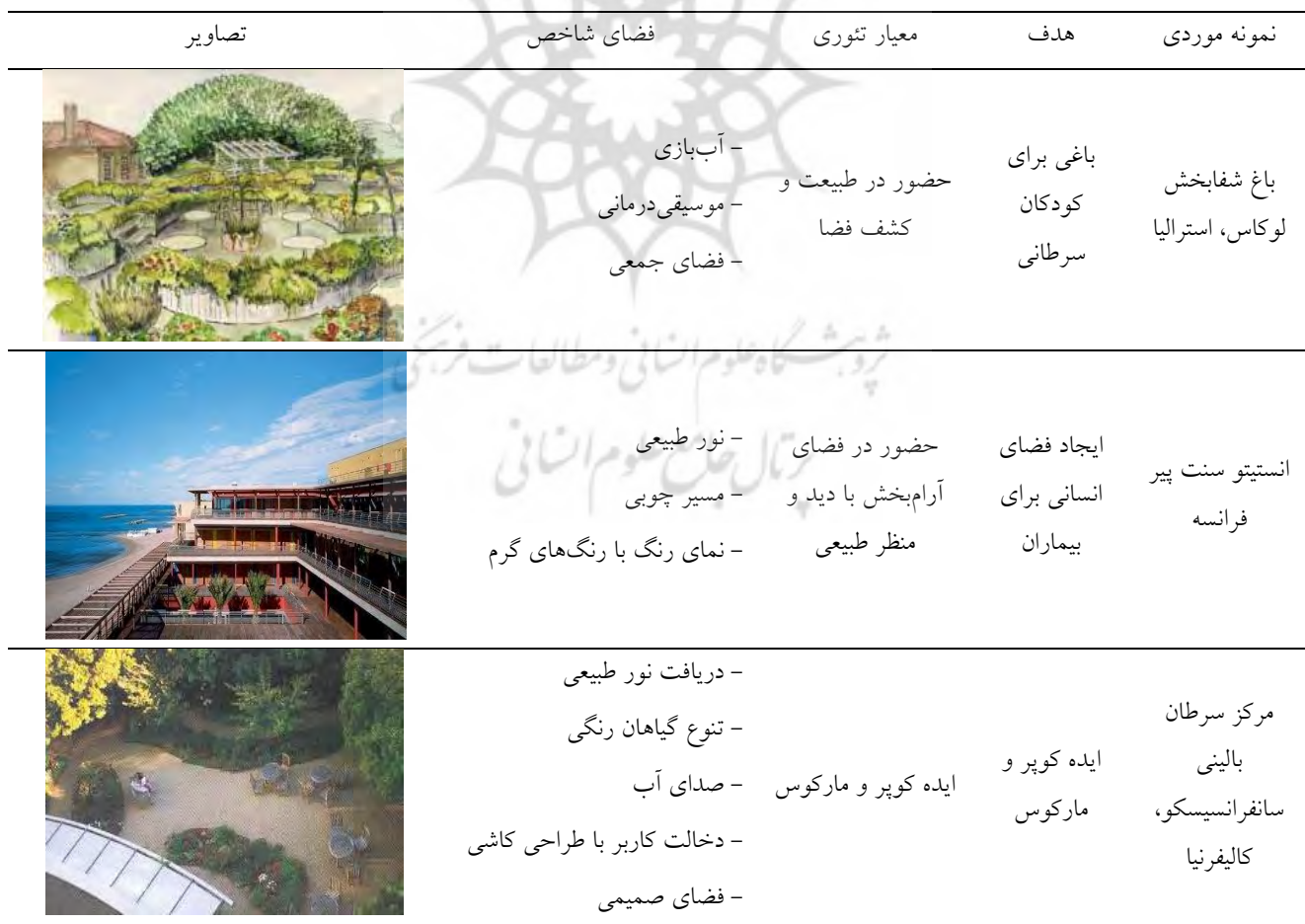
جدول ۳. بررسی نمونه‌های خارجی مناظر شفاف‌بخش (نگارنده)

همان‌طور که پیش‌تر گفته شد تا به امروز مطالعات گسترده‌ای بروی طراحی یک منظر شفاف‌بخش برای کودکان مبتلا به اوتیسم انجام نشده است و بالطبع همچنین فضایی برای این کودکان در سطح جهان وجود ندارد؛ اما نکته‌ای که قابل ذکر است در طی سالیان اخیر، تعدادی مناظر شفاف‌بخش در سطح جهانی با اهداف گوناگونی در شفاف‌بخشی احداث شده‌اند که با در نظر گرفتن فضاهای شاخص و معیار تئوری توانسته‌اند موفقیت خود را در زمینه مناظر شفاف‌بخش اثبات کنند. در ادامه نمونه‌هایی از این مناظر شفاف‌بخش را بررسی خواهیم کرد.