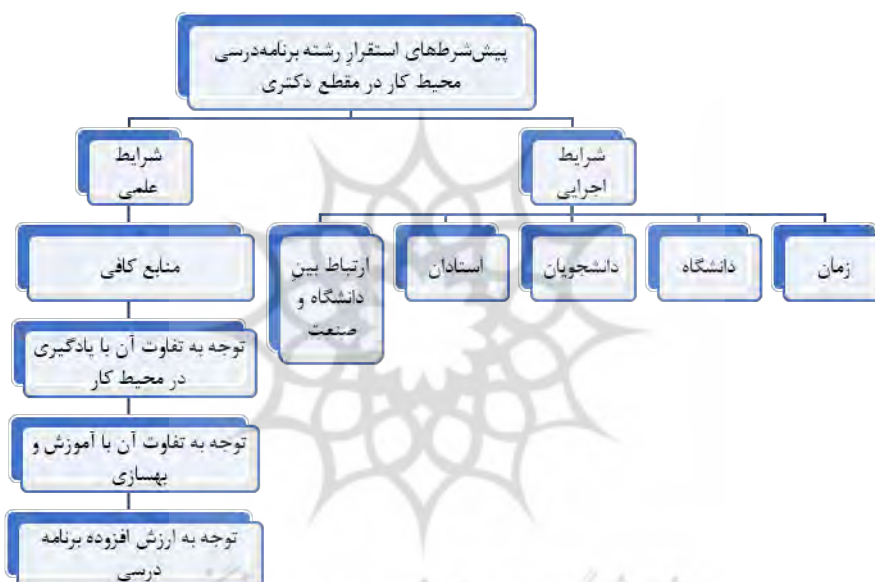
شکل ۲: پیش‌شرط‌های استقرار رشته برنامه‌درسی محیط کار در مقطع دکتری

رشته برنامه‌درسی محیط کار نباید محدود به یک رشته تلقی شود. باید برای رفع مشکلات مختلف و رسیدن به اهداف مشخص در حوزه یادگیری و آموزش کارکنان از حوزه‌های مختلف علمی و متخصصان گوناگون کمک بگیرد. حوزه‌هایی نظیر یادگیری در محیط کار، آموزش و بهسازی منابع انسانی، روان‌شناسی یادگیری و منابع انسانی نیز می‌توانند در مسیر تحقق هدف‌های برنامه‌درسی محیط کار موثر باشند. محدود کردن رشته برنامه‌درسی محیط کار به یک حوزه علمی خاص می‌تواند این رشته را به انزوا بکشاند و کم‌کم آن را به زمینه‌ای فقط در عرصه نظریه و شعار تبدیل کند. لازم است به رشته‌برنامه‌درسی محیط کار علاوه بر بستر مطالعاتی در زمینه عمل نیز پرداخته شود تا زمینه تحقق اهداف و دستاوردهای نظری آن در عرصه‌ی عمل نیز پدید آید.