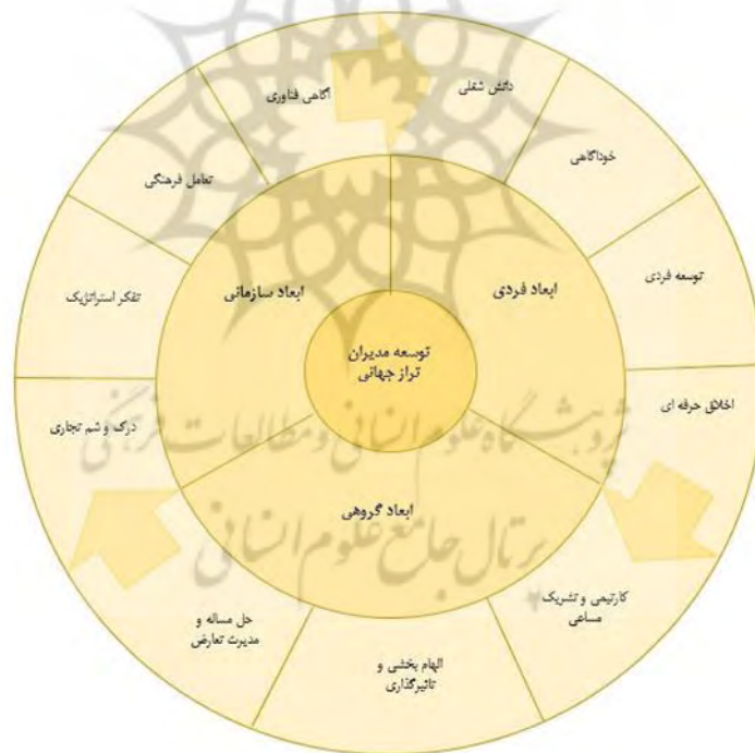
نمودار ۳: مدل برگرفته از نتایج پژوهش (الگوی نهایی تحقیق)

نتایج برگرفته از پژوهش بیانگر این موضوع است مدیران برای تبدیل شدن به یک مدیر تراز و در سطح جهانی باید دارای ویژگیهای خاصی در سه بعد اصلی شامل بعد فردی، گروهی و سازمانی باشند. نتایج کلی به عنوان چارچوب مفهومی پژوهش در شکل زیر نمایش داده شده است.