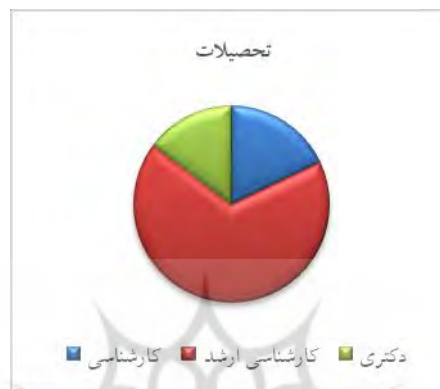
نمودار شماره ۲: فراوانی مدرک تحصیلی مشارکت کنندگان

مقادیر مربوط به تحصیلات مشارکت کنندگان، به تفکیک در سه مدرک کارشناسی، کارشناسی ارشد و دکتری نشان می دهد بیشترین فراوانی مربوط به دارندگان مدرک کارشناسی ارشد با ۶۷/۳ درصد سپس مدرک تحصیلی کارشناسی ارشد با ۹/۱۷ درصد و بعد مدرک تحصیلی دکتری با فراوانی ۱۴/۷ می باشد.